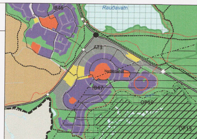
Úr aðalskipulagi Reykjavíkur 2010 - 2030