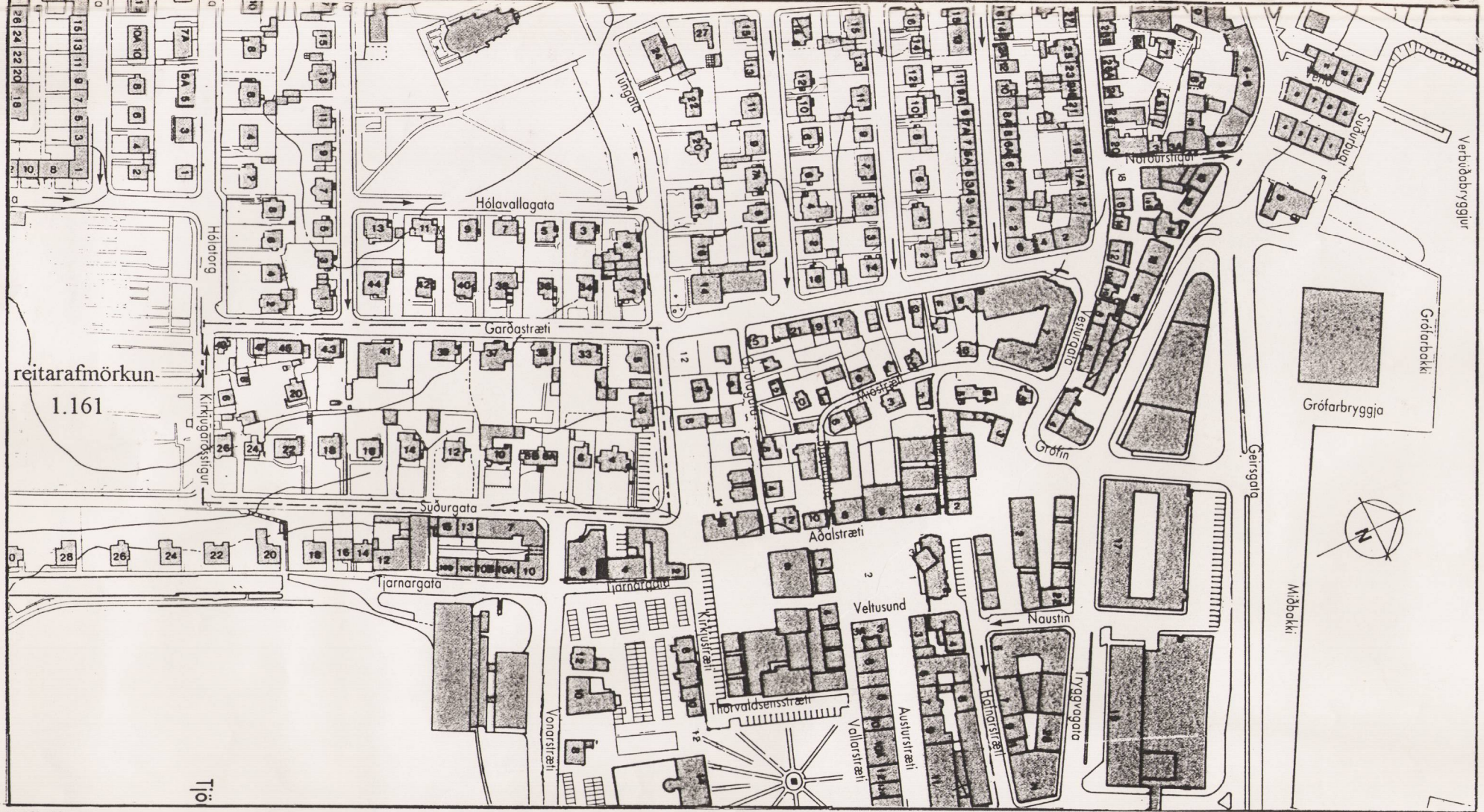
Yfirlitsmynd - mkv. 1:3000