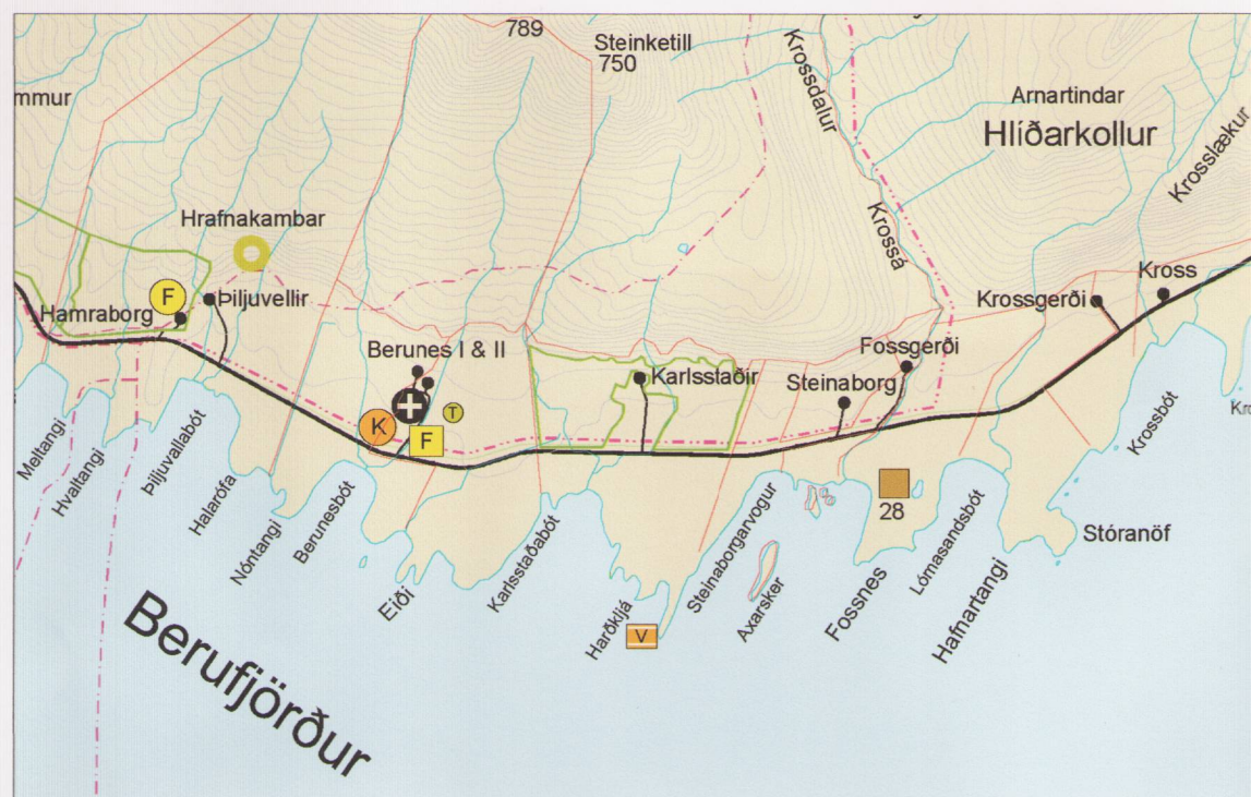
AÐALSKIPULAG DJÚPAVOGSHREPPS 2008-2020. MKV. 1:50.000