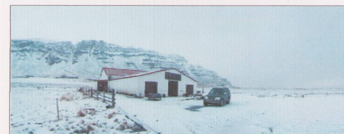
Mynd 2. Útihús, fjárhús og hlaða

Á Karlsstöðum líta landeigendur svo á að frekari uppbygging ferðapjónustu á jörðinni gegni lykilhlutverki í að styðja við áframhaldandi búskap og rekstur á jörðinni. Í framlögðum áætlunum landeiganda er gert ráð fyrir að fjölgast gistirýmum í allt að 34 með því að breyta núverandi fjárhúsum, sem eru hluti af fyrrgreindum útihúsum, í gistirými. Heildargrunnflötur útihúsanna (fjárhús og hlaða) er um 340 m 2 .