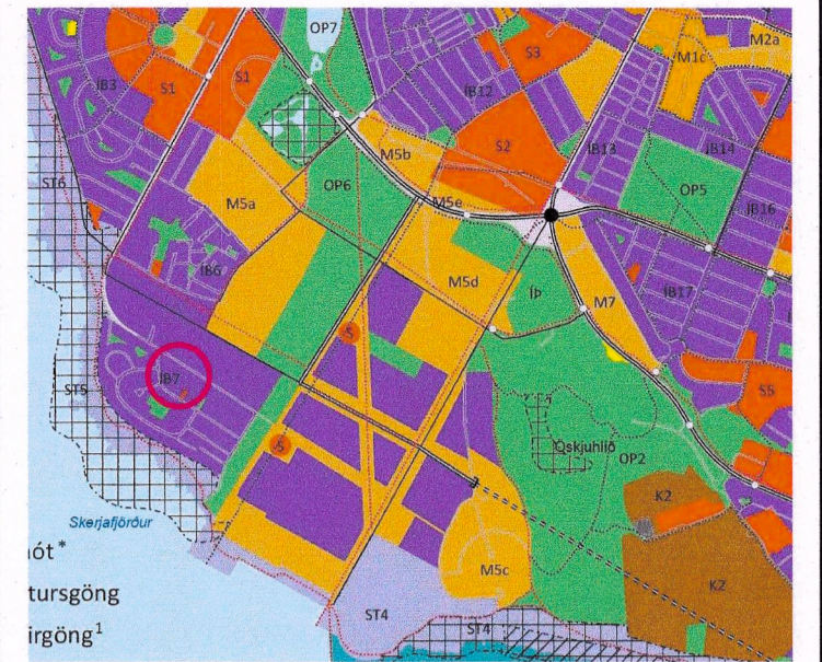
Hluti aðalskipulags Reykjavíkur 2010-2030 (ekki í kvarða)

Breytingin felst í færslu á lóðamörkum á milli eignanna nr. 44 og 44a, þannig að bílastæði á baklöð húss nr. 44 verði hluti af lóð 44a. Einarsnes 44 er tvíbýli en Einarsnes 44a á baklöð er einbýli. Á lóð húss nr. 44a er nú eitt stæði framan við bílgeymslu. Umrætt bílastæði er þar við hlið. Stærð bílastæðis er 2,7 x 6 m, þ.e. 16,2 m 2 . Breytingin felur í sér að lóð húss nr. 44 minnkar um 16 m 2 úr 413 m 2 í 397 m 2 og lóð húss nr. 44a stækkar um 16 m 2 úr 432 m 2 í 448 m 2 . Kvöð um bílastæði á baklöð húss nr. 44 fellur burt. Önnur lóðamörk og aðkomulöð eru óbreytt og eignarhlutar húsa í aðkomulöð eru óbreyttir.