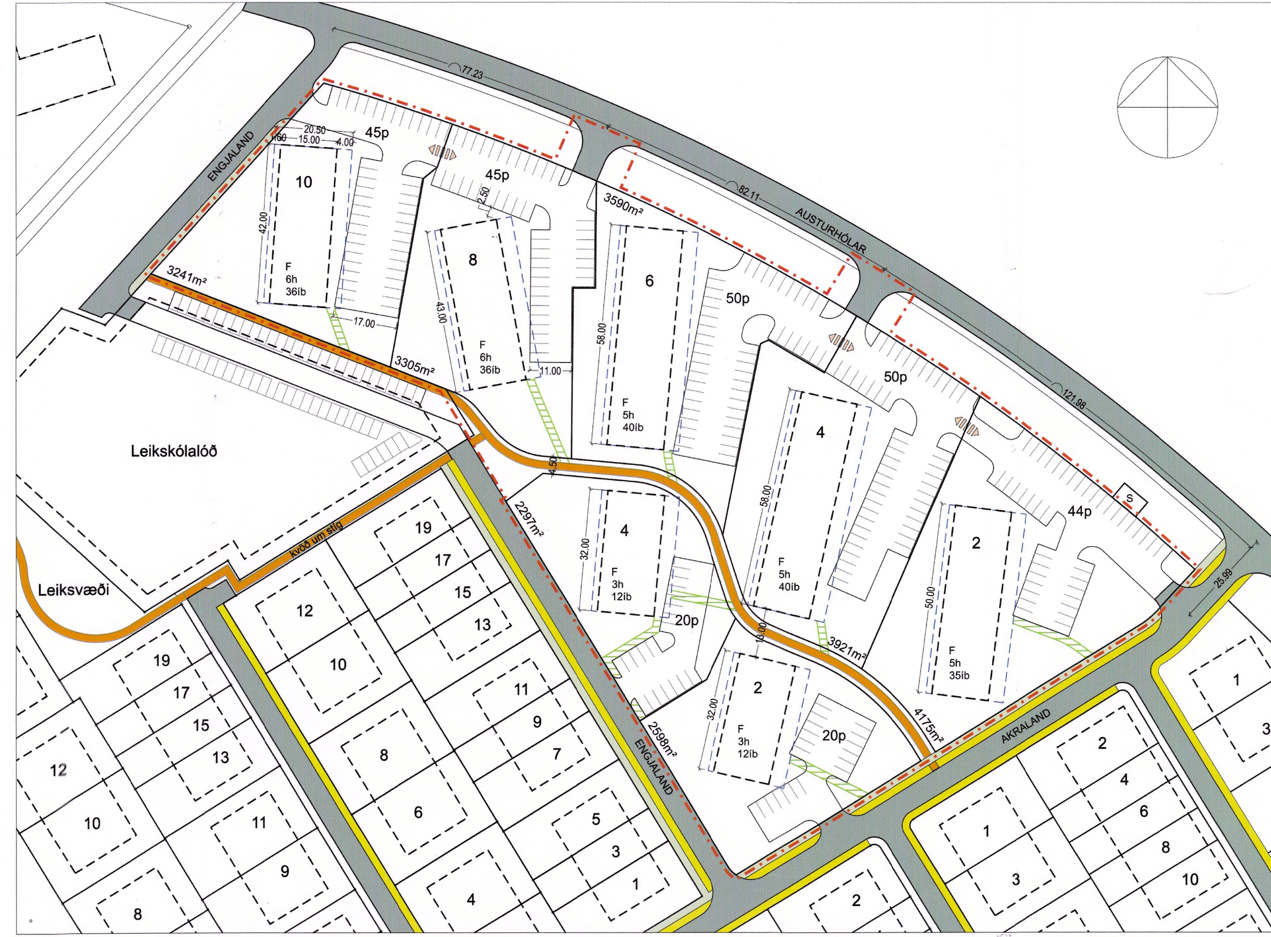
Deiliskipulag eftir breytingu - Mkv. 1:1000

Deiliskipulagsbreyting þessi sem auglýst hefur verið skv. 1. mgr. 43. gr. skipulagslaga nr. 123/2010 m.s.br. frá 13. maí 2020 til 24. júní 2020 var samþykkt í bæjarstjórn Árborgar þann 9. júlí 2020.