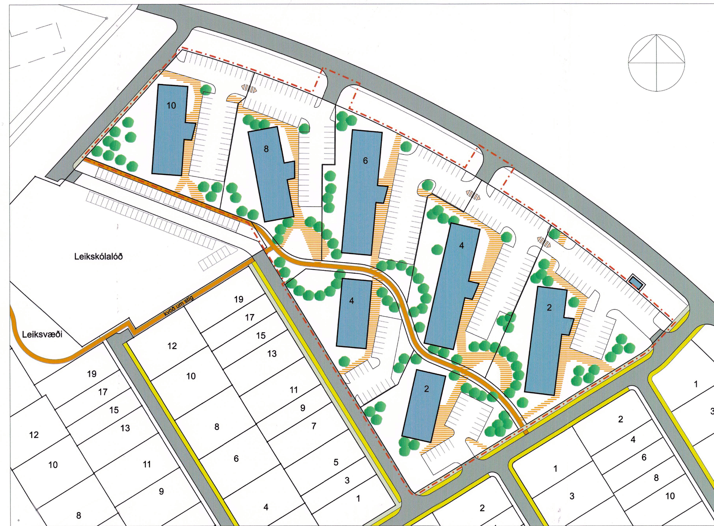
Skýringamynd - Mkv. 1:1000