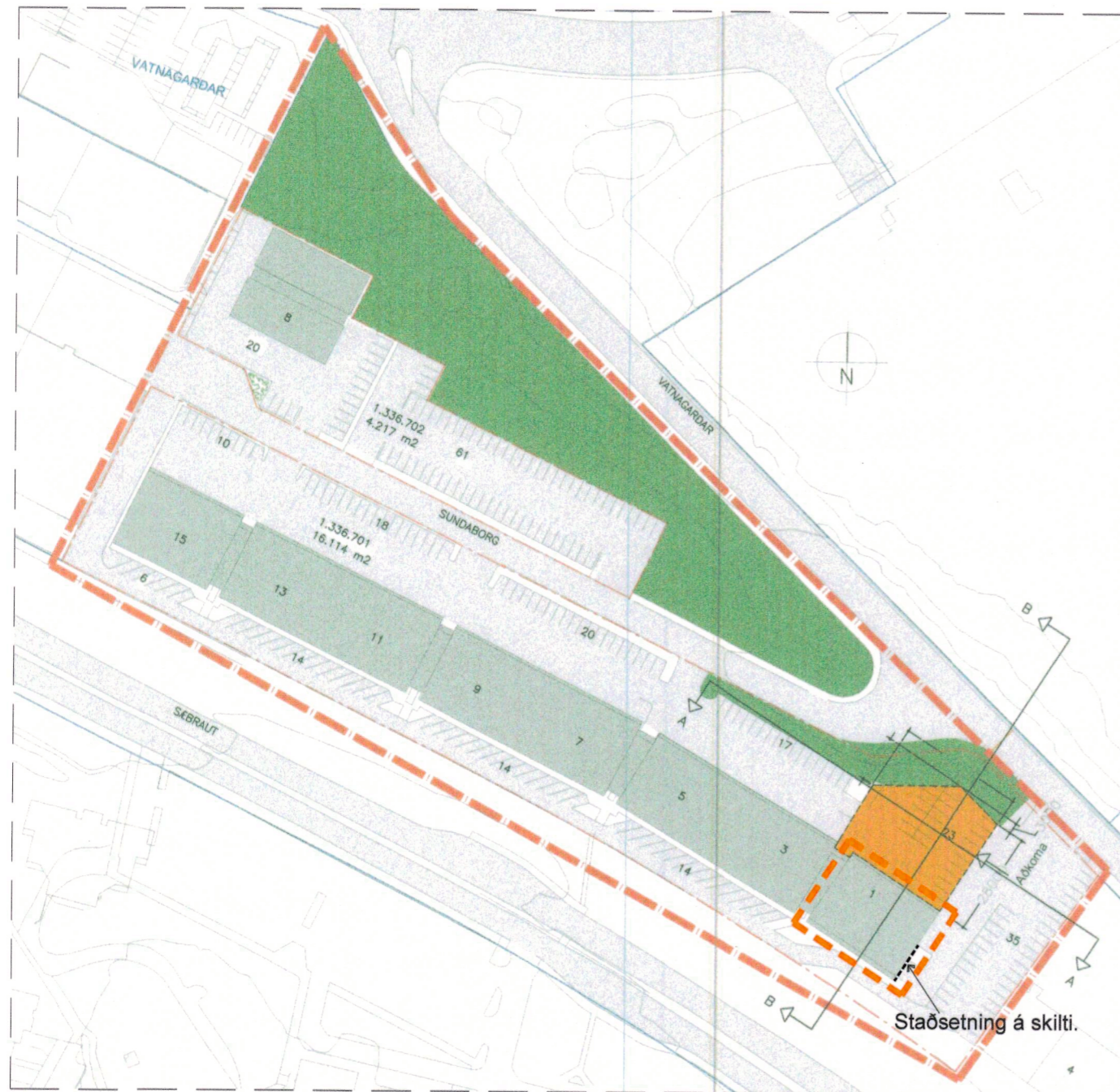
Núverandi deiliskipulag 1:2000. Uppdráttur breytist ekki.