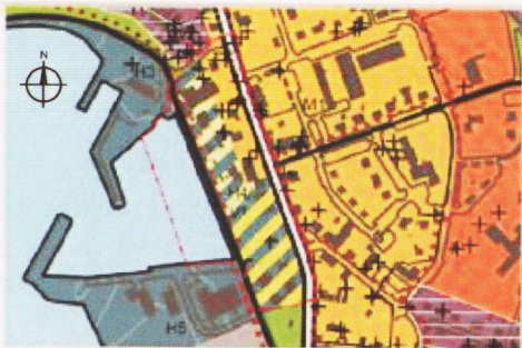
Breyting á aðalskipulagi Norðurlþingis 2010-2030 / Mkv. 1 : 10.000 [ - - - - - mörk deiliskipulags bætt við ]