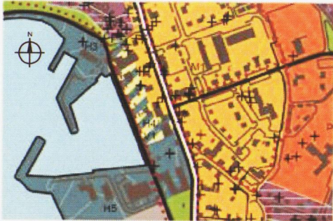
Úr aðalskipulagi Norðurlþingis 2010-2030 / Húsavík, samþykkt af umhverfisráðherra 22.12.2010. - Mkv. 1 : 10.000