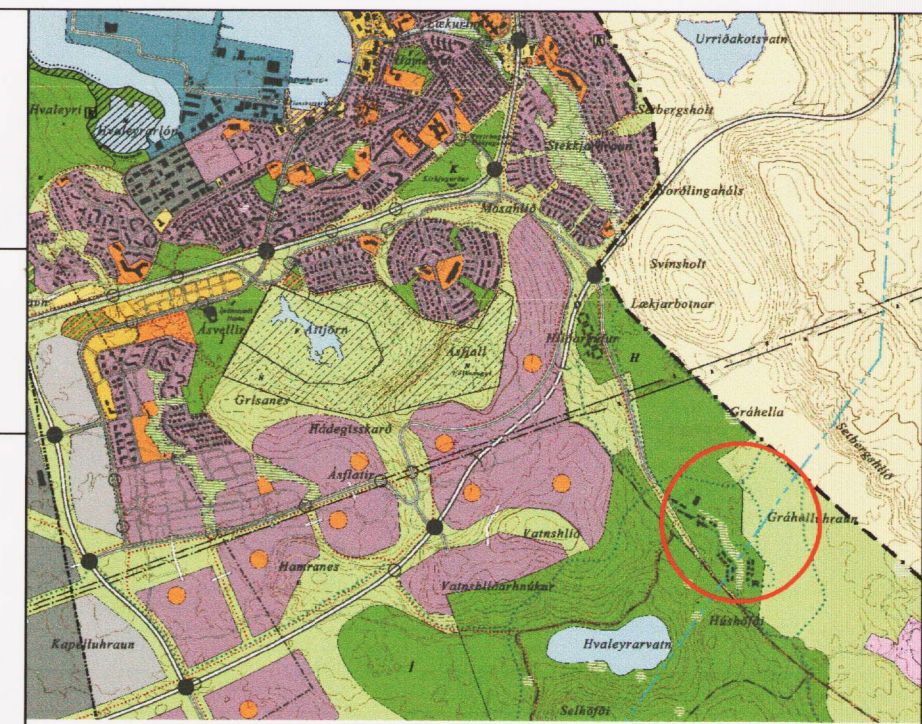
ADALSKIPULAG HAFNARFJARÐAR 2005-2025 Staðsetning í bæjarlandinu

Breytingin felur í sér fjölgun á minni hestúsum við Fluguskeið. Tvær lóóir bætast við Kaplaskleið nr. 24 og 26 húsagerð 1. Þrjár lóóir verða felldar út við Fluguskeið 1, 2 og 3 og Sörlaskleið 35. Svæði hverfisvermdar breytist og stækkar. Númer á húsum breytast: Í stað húsa nr. 8 og 10, húsagerð 4, verði 3 hús nr. 6, 8 og 10, húsagerð 2. Í stað húss nr. 9, húsagerð 4, verði tvö hús nr. 7 og 9, húsagerð 1. Í stað húss nr. 15, húsagerð 4, verði húsagerð 2. Stærðir á lóðum húsa nr. 13 og 15 breytast. Í stað húss nr. 17, húsagerð 4, verði tvö hús nr. 17 og 19, húsagerð 1. Hús nr. 19 við Fluguskeið verði nr. 21. Hús nr. 21 við Fluguskeið verði nr. 23. Að öðru leiti gilda skipulagsskilmálar "Athafnasvæði Hestamannafélags Sörla" útgáfa 0.2, dags. 25.08.2008.