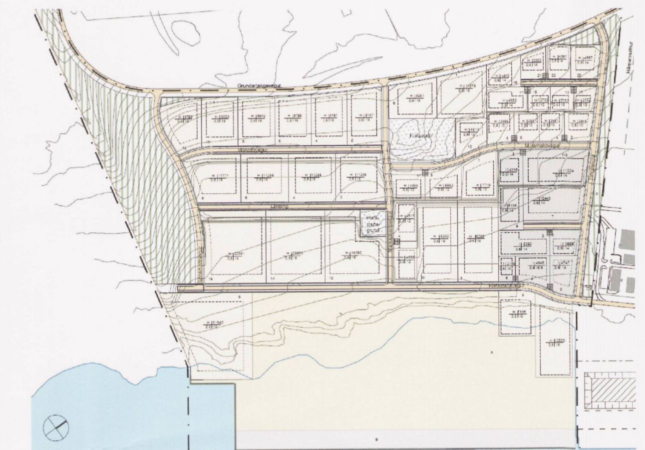
Deiliskipulag athafnasvæðis, athafna- og hafnarsvæðis og iðnaðarsvæðis á Grundartanga, vestursvæði. Breyting nóvember 2010.