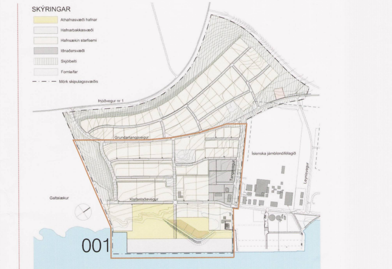
Yfirlitsuppdráttur (uppdr. 001, 002 og 003) Önnur skipulagsgögn - Deiliskipulagsuppdrættir nr. 002, 003 dags. 2012-08-10 - Yfirlitsuppdráttur nr. 004 dags. 2012-08-10. - Greinargerð, skipulags- og byggingarskilmálar, umhverfisáhrif dags. 2012-08-10

Breytingar á greinargerð eftir auglýsingu: Nýr kafli 4.1.11 Veitur Þar er m.a. eftirfarandi texti settur inn um tilhögun fræðisniðmála til bráðabirgða: Öllum fyrirtækjum á deiliskipulagsvæðinu verður gert að veita skóplí í rotþræð að teknu tilliti til stærðar og starfsemi viðkomandi fyrirtækis. Ölfanvatni verður veitt til sjávar með aðalögn.