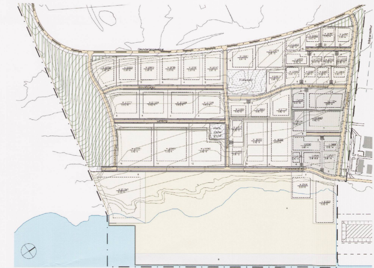
Deiliskipulag athafnasvæðis, athafna- og hafnarsvæðis og iðnaðarsvæðis á Grundartanga, vestursvæði. Breyting nóvember 2010.