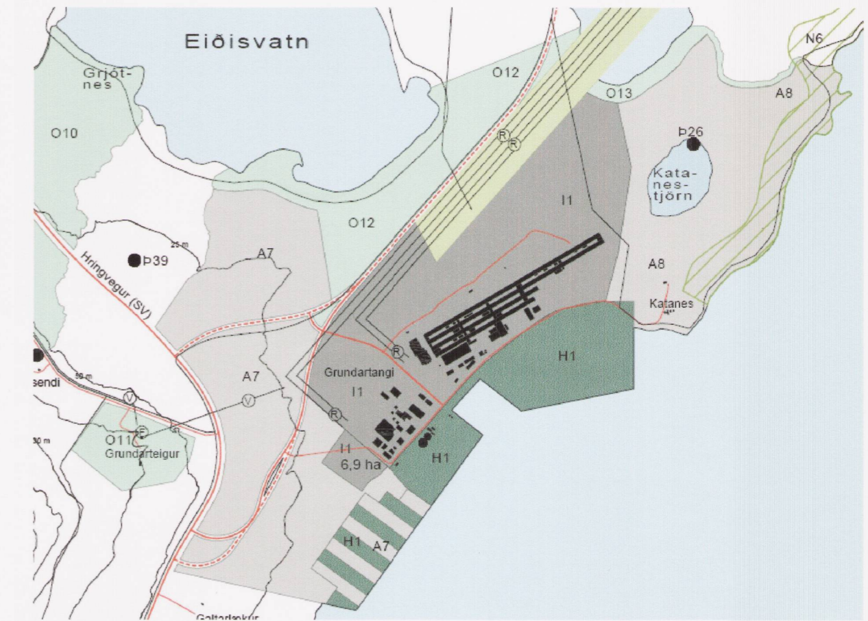
Hluti úr aðalskipulagi Hvalfjörðarsveitar 2008-2020. Breyting nóvember 2010.