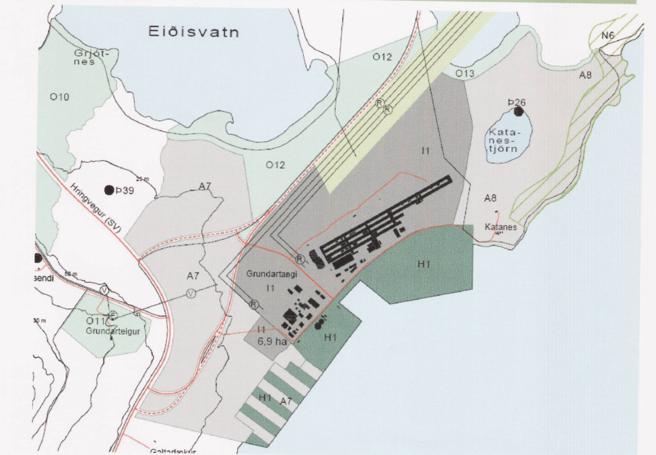
Hluti úr aðalskipulagi Hvalfjarðarsveitar 2008-2020. Breyting nóvember 2010.