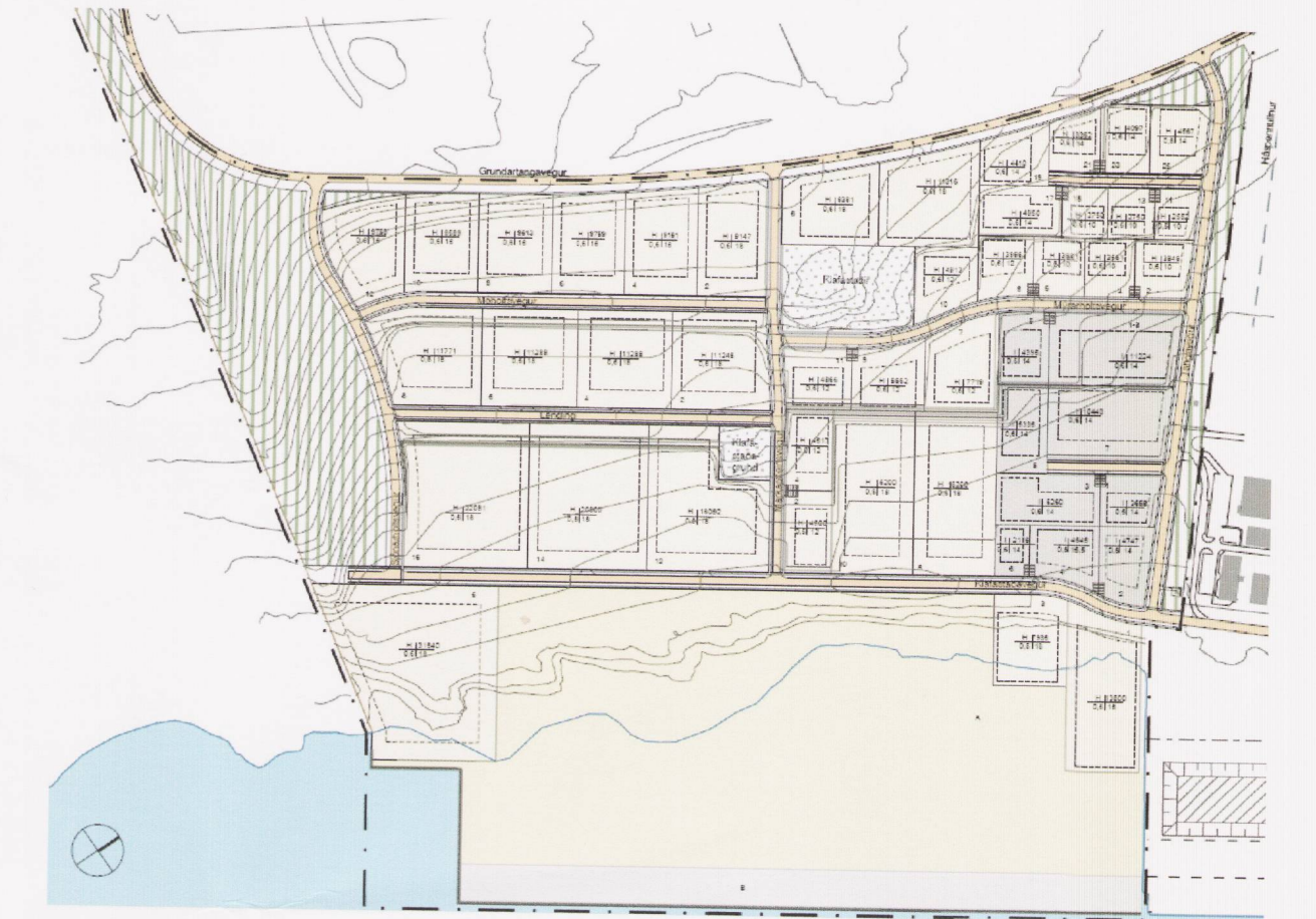
Deiliskipulag athafnasvæðis, athafna- og hafnarsvæðisog iðnaðarsvæðis á Grundartanga, vestursvæði. Breyting nóvember 2010.