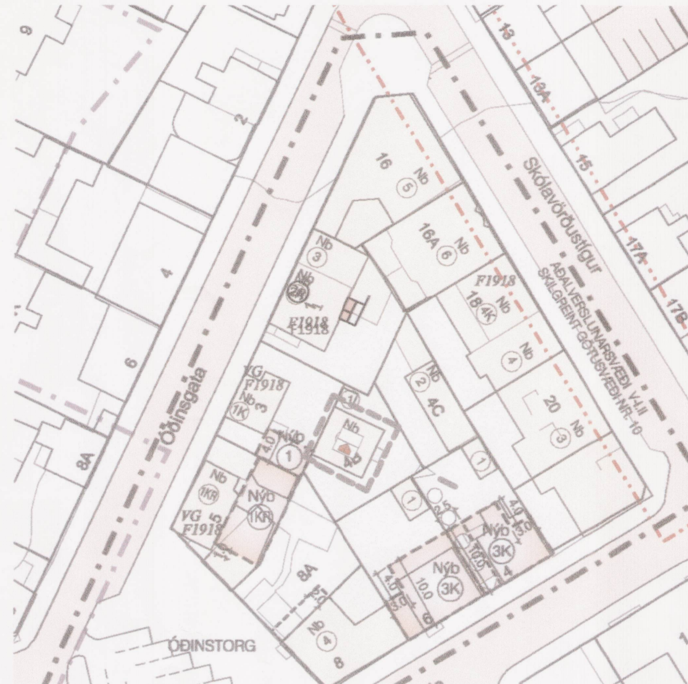
TILLAGA AÐ BREYTTU DEILISKIPULAGI - TYSGATA 4B

Samþykkt í borgarráði 4-2-2003 og auglýst í B-deild stjórnartíðinda 12-3-2003