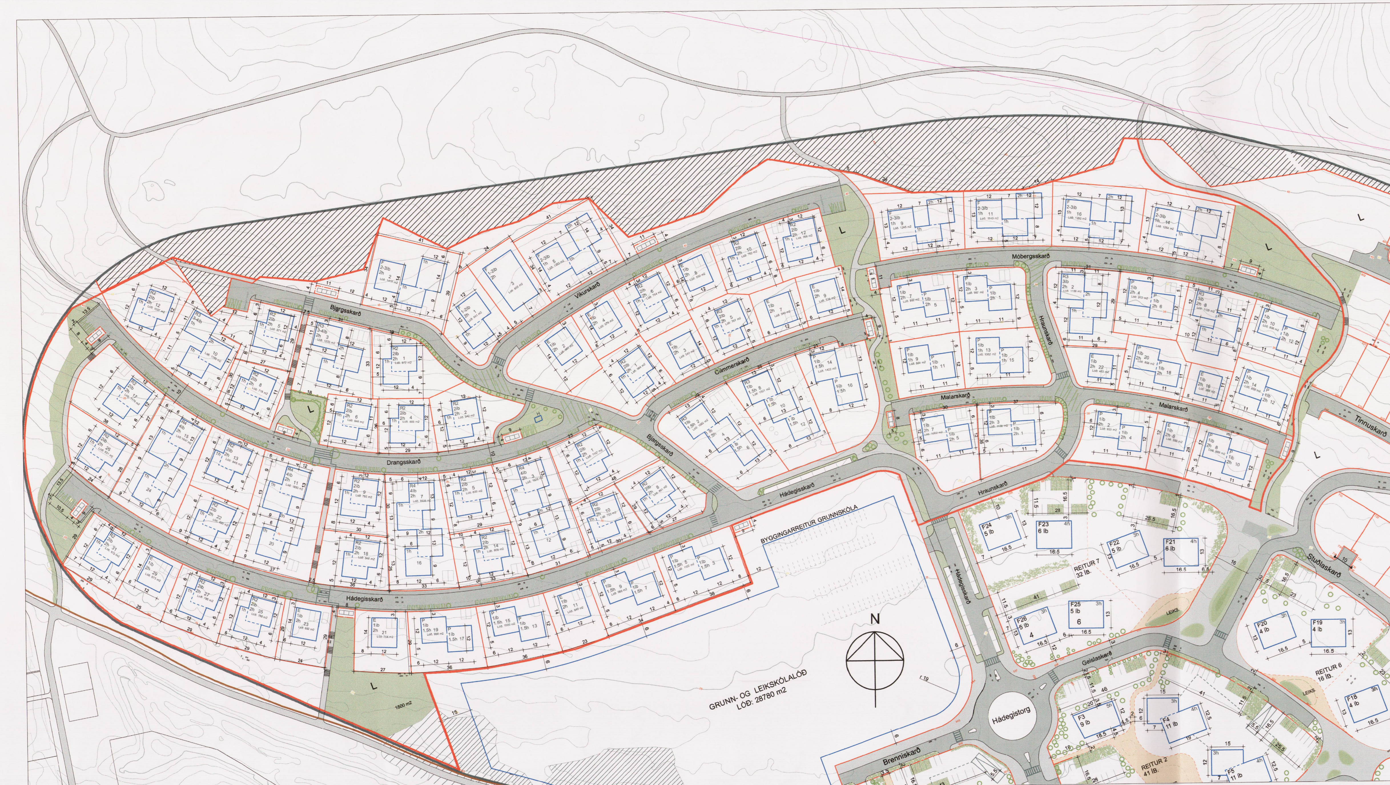
TILLAGA AÐ BREYTTU DEILISKIPULAGI SKARÐSHLIÐAR, 2.ÁFANGI. MKV. 1:1000