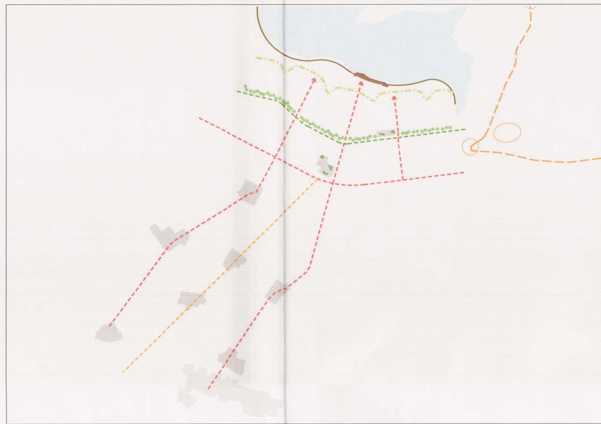
SKÝRINGARMYND - HUGMYNDAFRÆÐI OG TENGINGAR, dags. 8.mai 2017, mkv. 1:4000