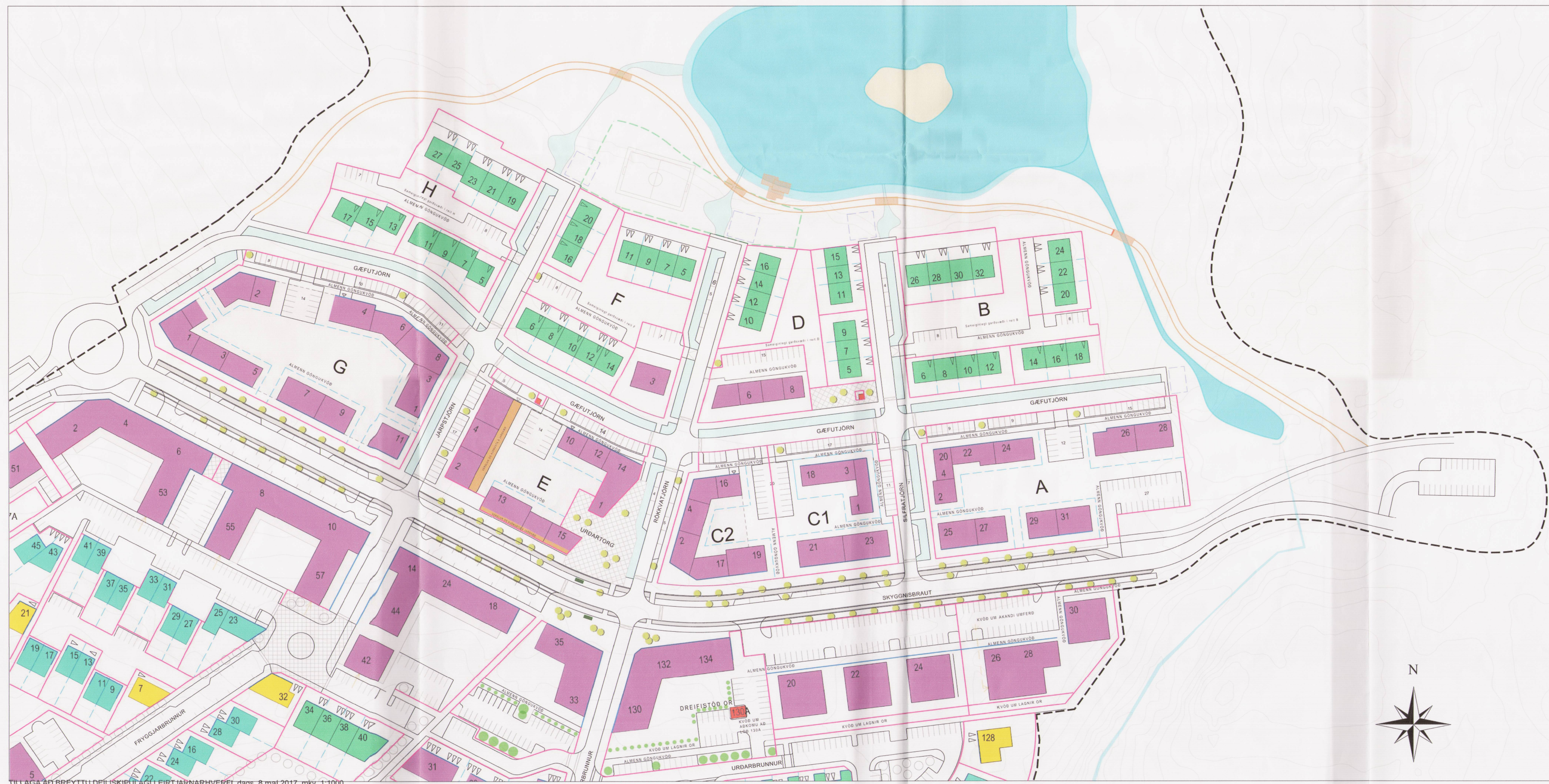
TILLAGA AD BREYTTU DEILISKIPULAGI LEIRT JARNARHVERFI, dags. 8.mai 2017, mkv. 1:1000

ÚTGEFANDI: Richard Ó. Briem KT: 210850-4499