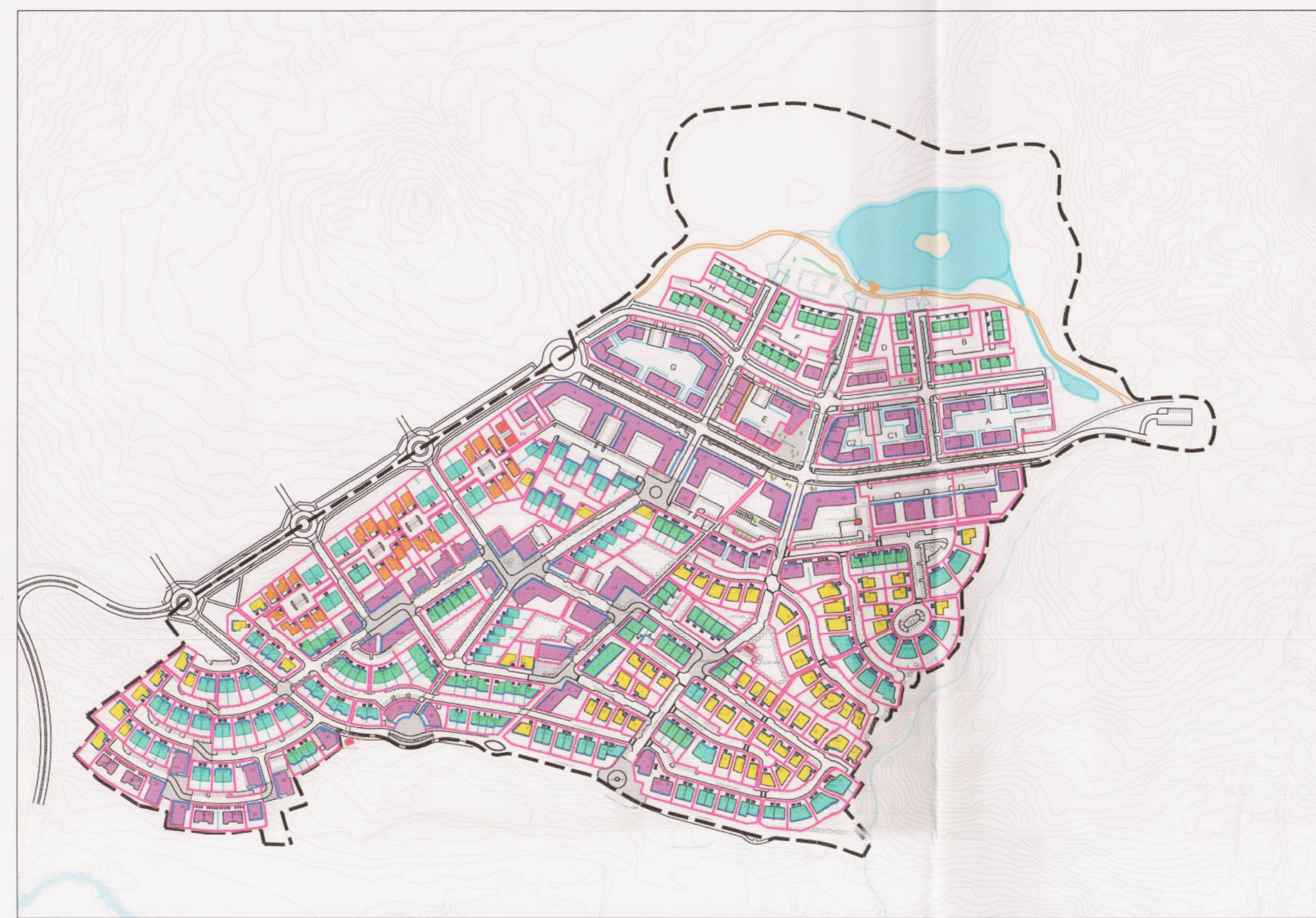
TILLAGA AD BREYTTU DEILISKIPULAGI ÚLFARSÁRDALUR, dags. 8.mai 2017, mkv. 1:5000