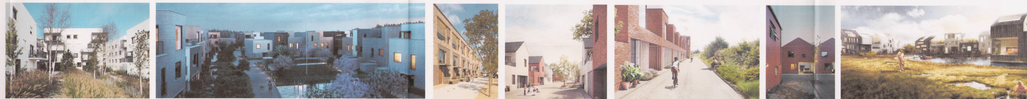
TILVÍSUNARMYNDIR - STADARANDI