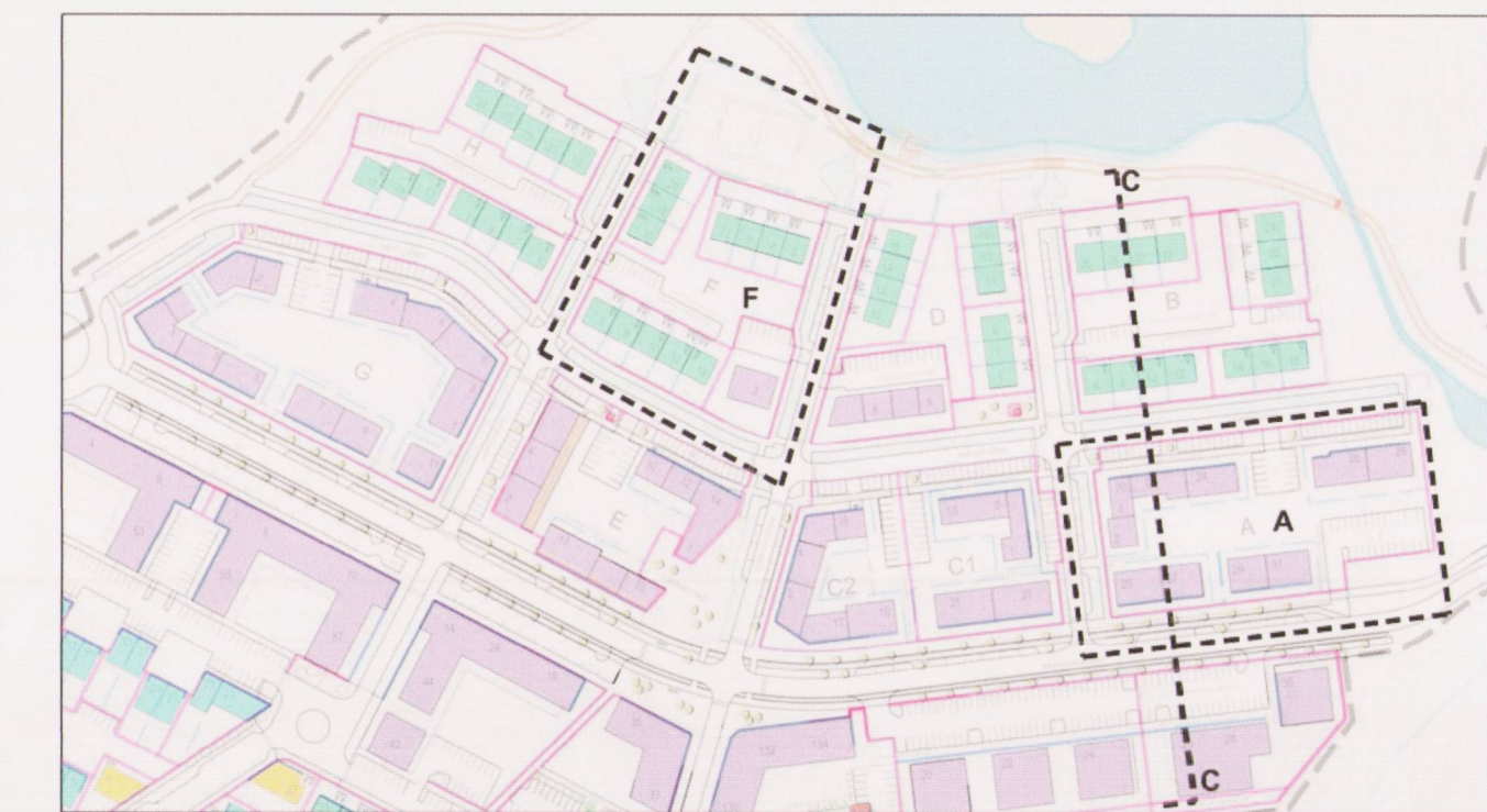
SKÝRINGARMYND, sniðlinur og reitir