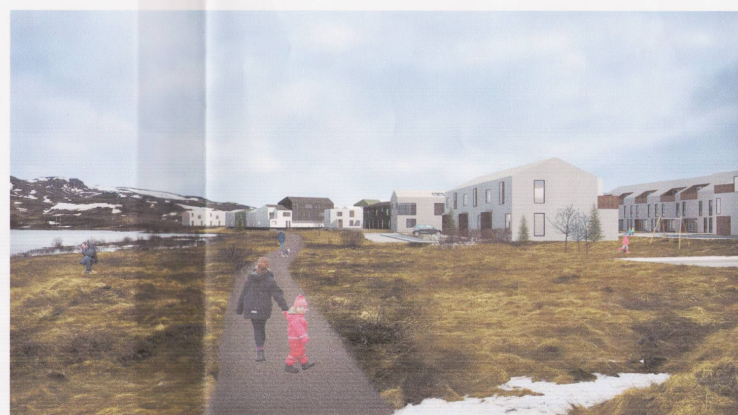
HUGMYND AD NÝRRI ÍBÚÐABYGGÐ OG ÚTIVISTARSVÆÐI VIÐ LEIRTJÖRN

BREYTT AD LOKNUM AUGLÝSINGATÍMA 15.09.2017 Sjá nánar greinargerð og skilmála.