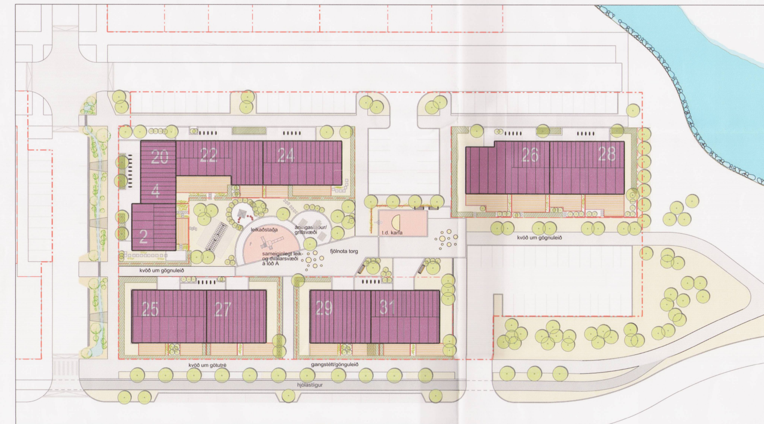
SKÝRINGARMYND AF REIT A, SÝNIR MÖGULEIKA Á LÖÐ. STADSETNING GRÖÐURS LEIÐBEINANDI, MÆLIKVARDI 1:500