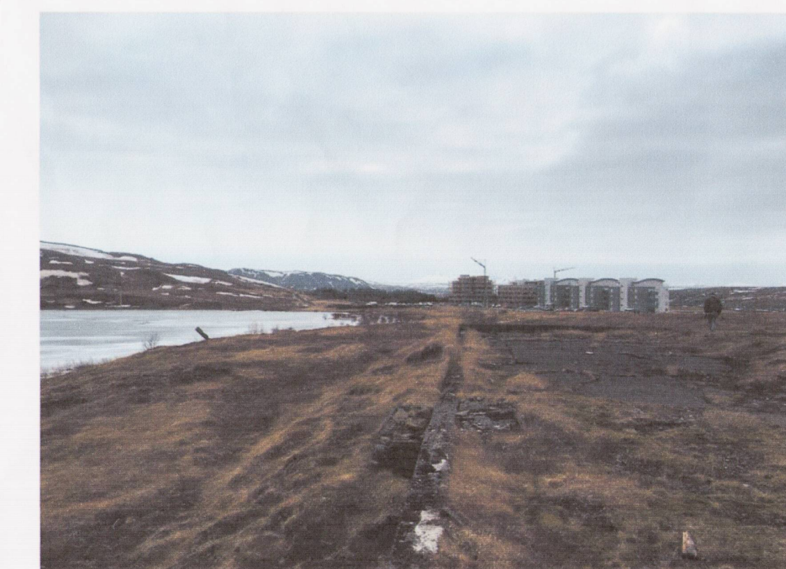
LEIRTJÖRN Í DAG