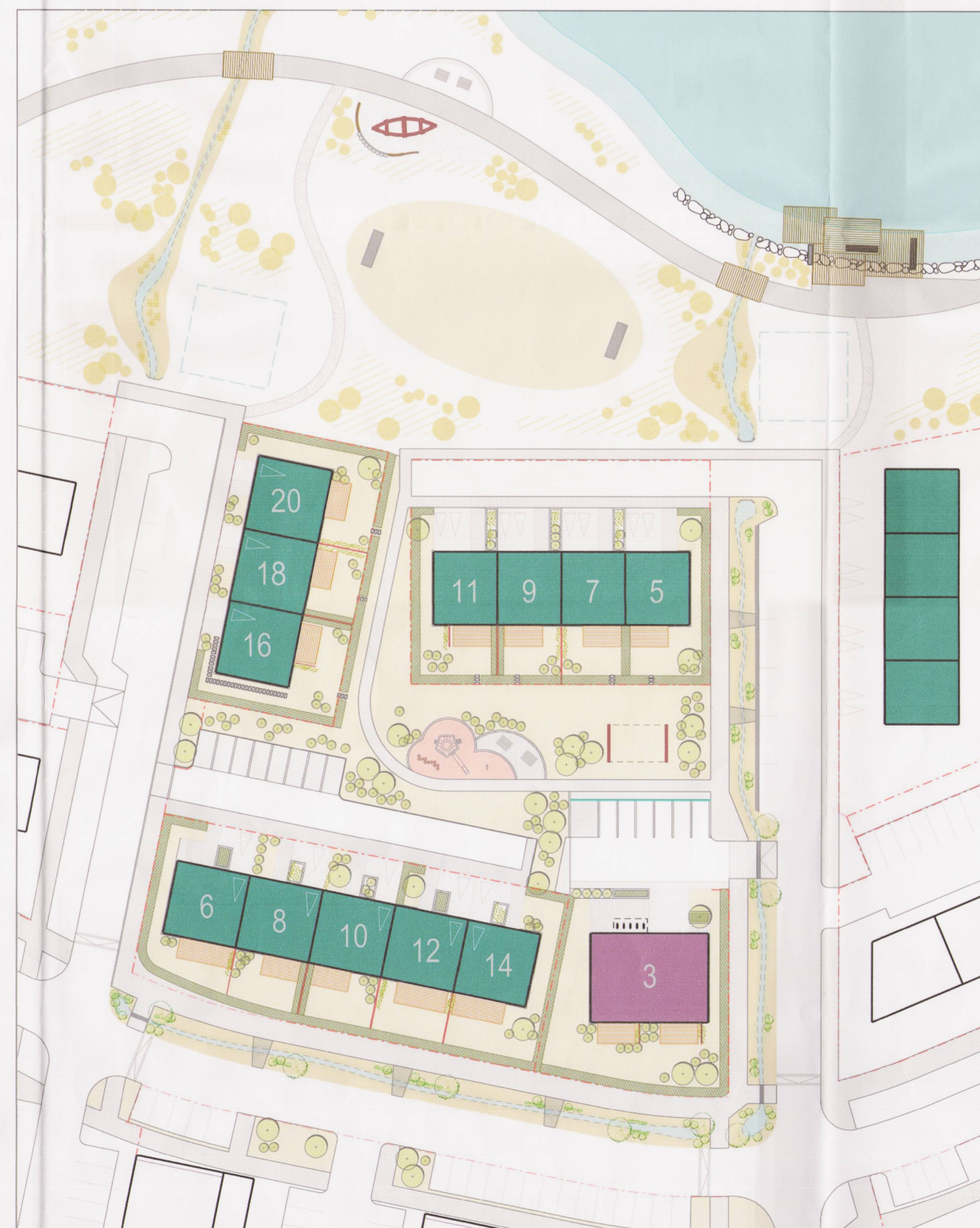
SKÝRINGARMYND AF REIT F, SÝNIR MÖGULEIKA Á LÖÐ. STADSETNING GRÖÐURS LEIÐBEINANDI. SÝNIR EINNIG LEIKSVÆÐI VIÐ LEIRTJÖRN, MÆLIKVARDI 1:500