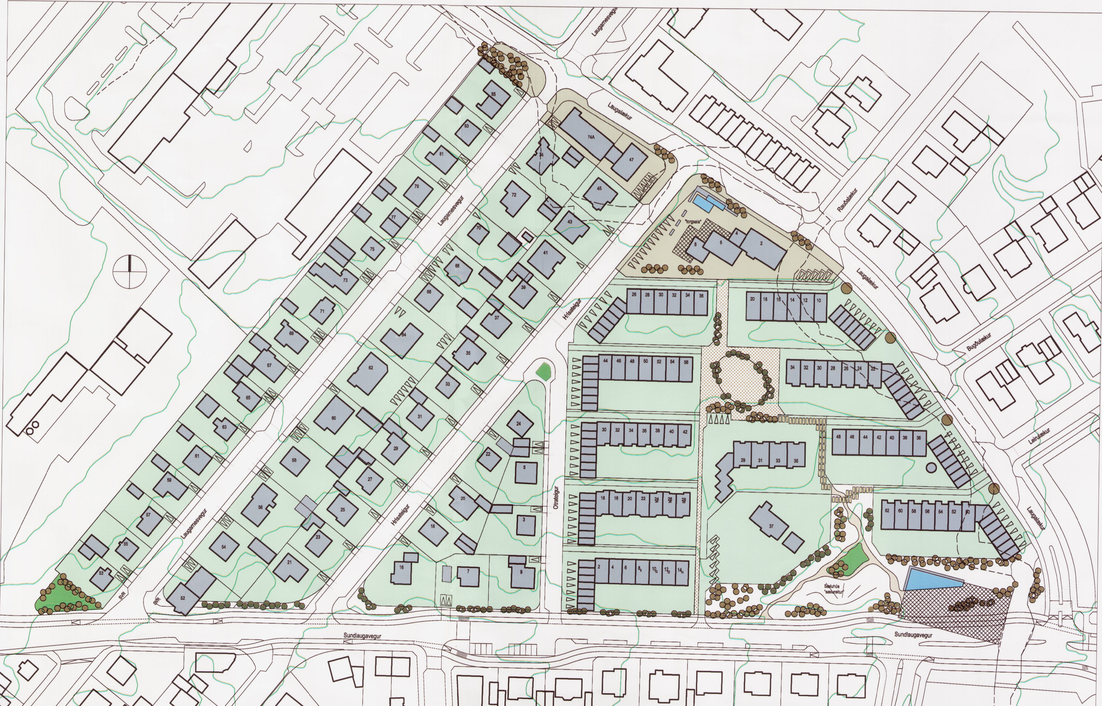
Skýringaruppdráttur M 1:1000

7.1.3 Áningarstaðir Í tengslum við endurbætur hjóla- og gönguleiða meðfram Sundlaugavegi, verða áningarstaðir. Áningarstaðirnir eru hugsaðir sem hvíldar eða sælureitir fyrir þá sem leið eiga hjá. Á áningarstöðum er gert ráð fyrir bekkjum og gróðursetningu trjáa í tengslum við gróðursetningu trjáa meðfram Sundlaugavegi. Á áningarstað á gatnamótum Laugarnesvegjar er biðstöð SVR og hugsa mætti sér að biðskýli væri einhverskonar sæluhús þar sem gestir geta yljá sér í köldu veðri.