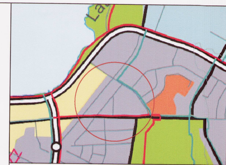
Aðalskipulag Reykjavíkur 2001-2024