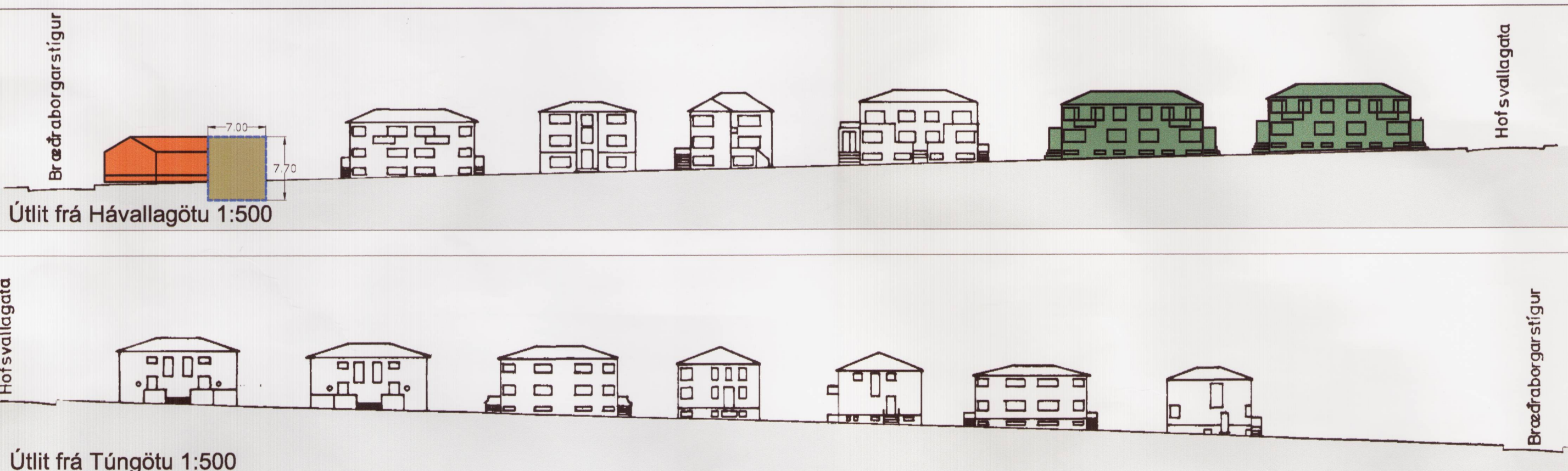
Tillaga að deiliskipulagi 1:500