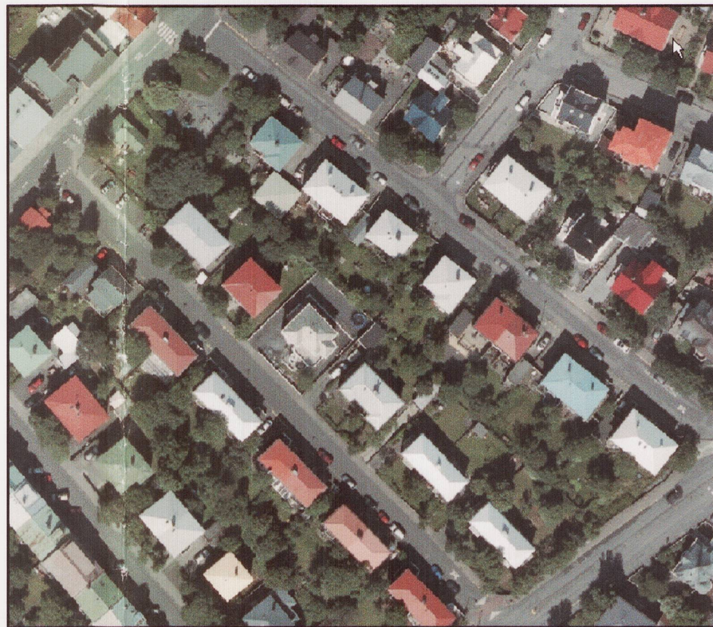
Loftmynd núverandi ástand