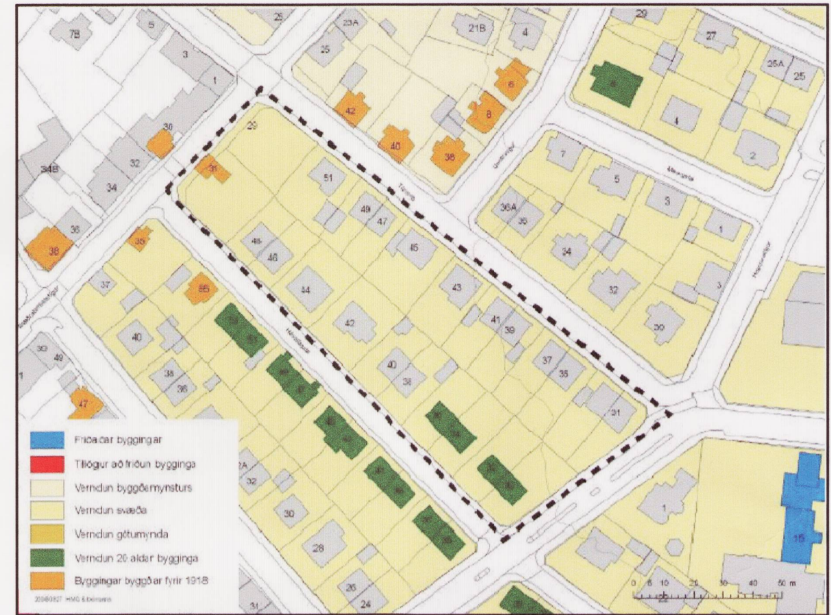
Kort verndunargildi húsa