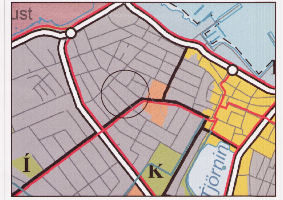
Hluti Aðalskipulags Reykjavíkur 2001-2024