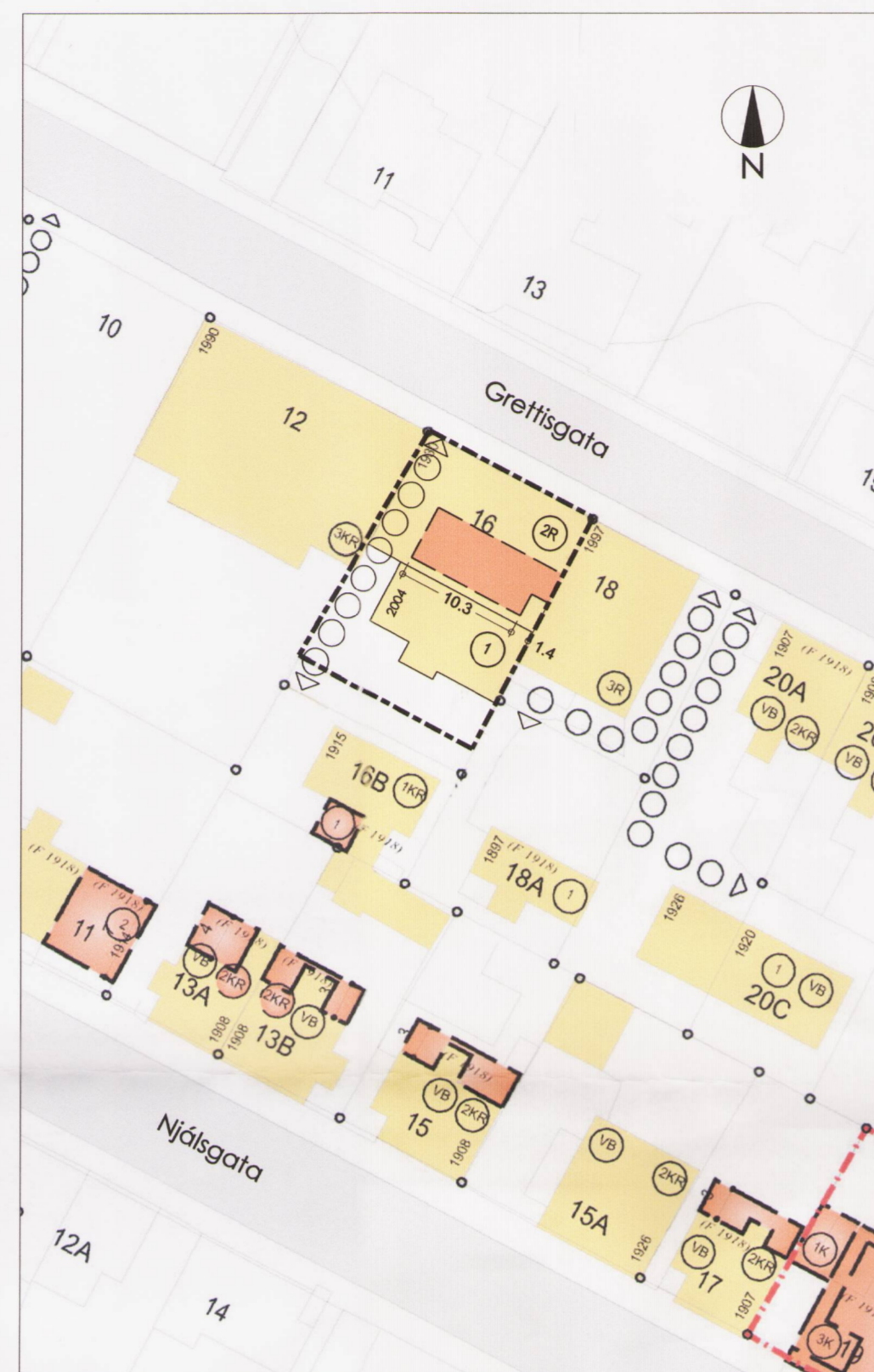
Breyting á deiliskipulagi mkv. 1:500