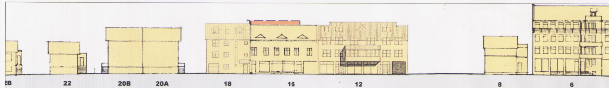
Kennisnið Grettisgata mkv. 1:500