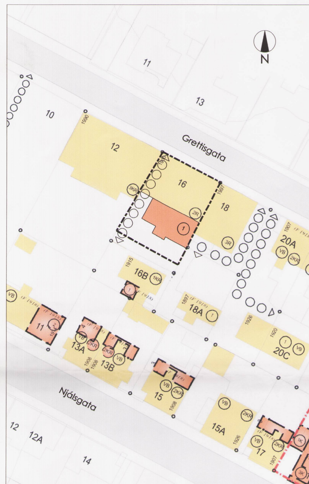
Deiliskipulag mkv. 1:500 Samþykkt í borgarráði 1. apríl 2003, breyting samþykkt í skipulags- og byggingarnefnd 12. maí 2004