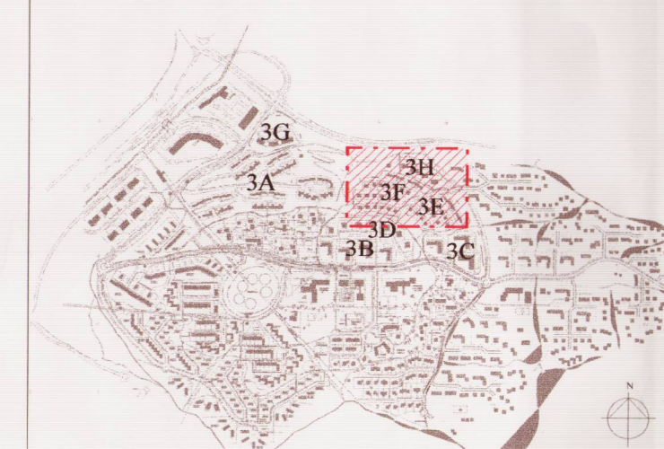
Yfirlitsmynd af Grafarholti