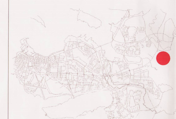
Yfirlitsmynd af Reykjavík