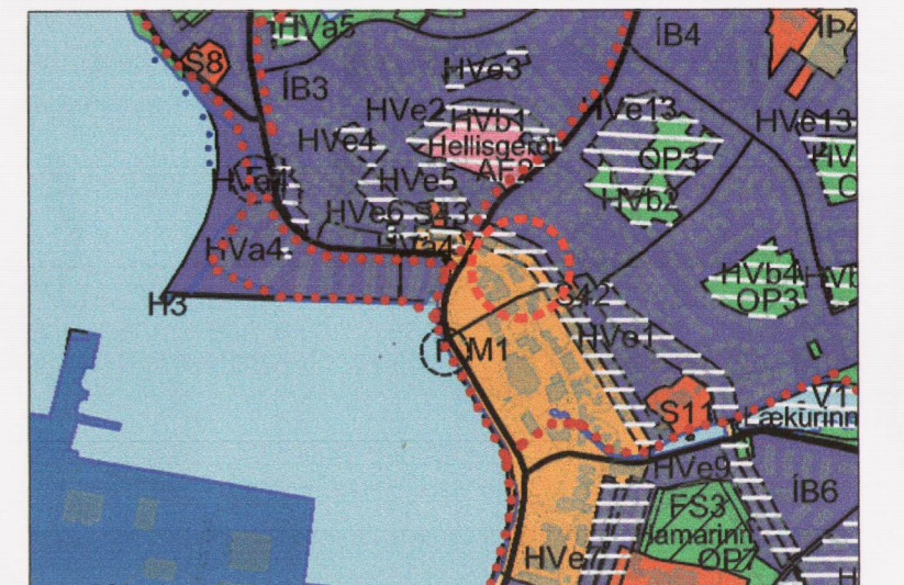
ADALSKIPULAG HAFNARFJARÐAR 2013 - 2025

Hafnarfjörðurbær Skipulagsfulltrúi 16.5.17 Skipulagsfulltrúi