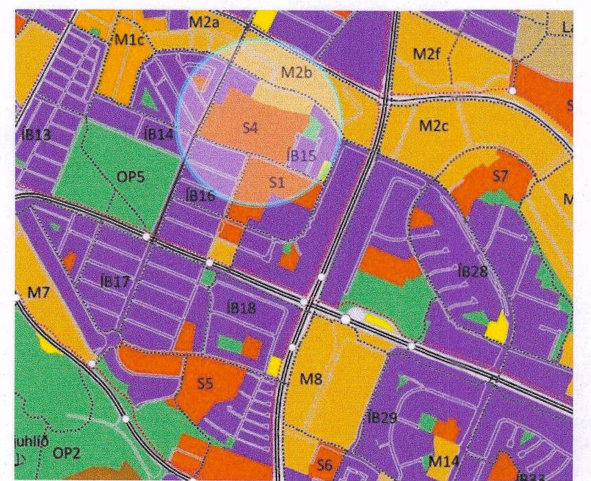
Hluti aðalskipulags Reykjavíkur 2010-2030 SKÝRINGAR