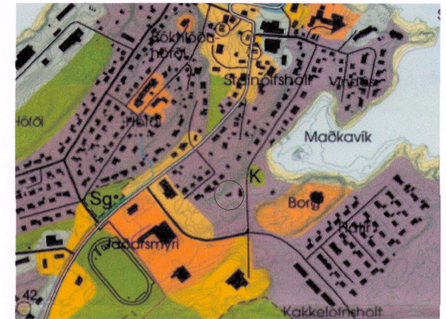
Aðalskipulag Stykkishólmsbæjar 2002-2022