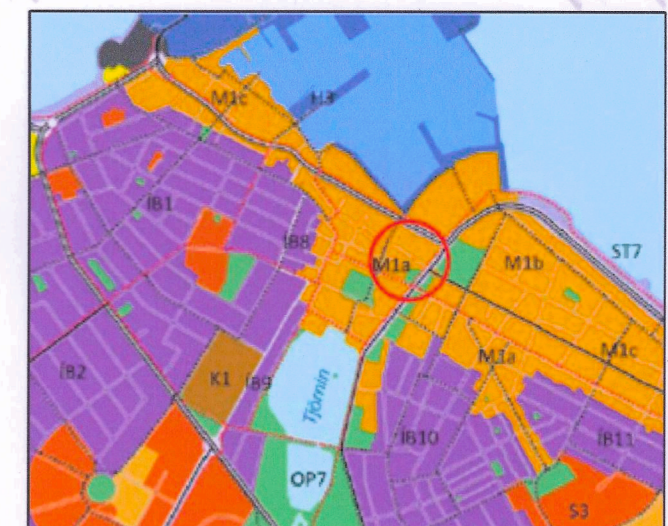
Hluti úr aðalskipulagi Reykjavíkur 2010-2030 - staðsetning breytingar.