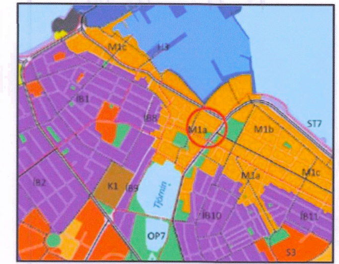
Hluti úr aðalskipulagi Reykjavíkur 2010-2030 - staðsetning breytingar.