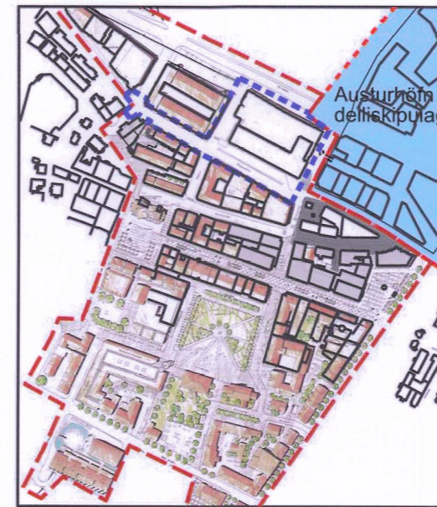
Skýringarmynd - Kvosarskipulag