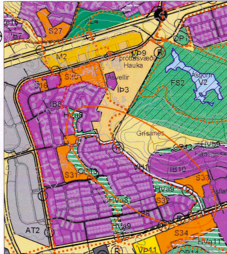
Breytt landnotkun — Mörk breytinga 1:15.000