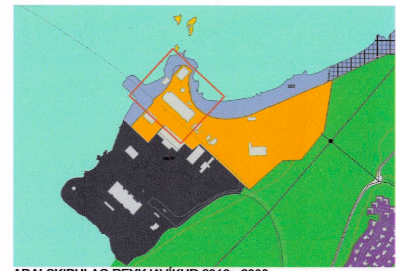
ADALSKIPULAG REYKJAVÍKUR 2010 - 2030