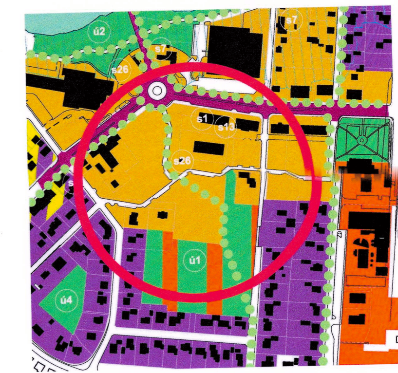
Árborg aðalskipulag 2010-2030, úr þéttbýlisupprætti fyrir Selfoss