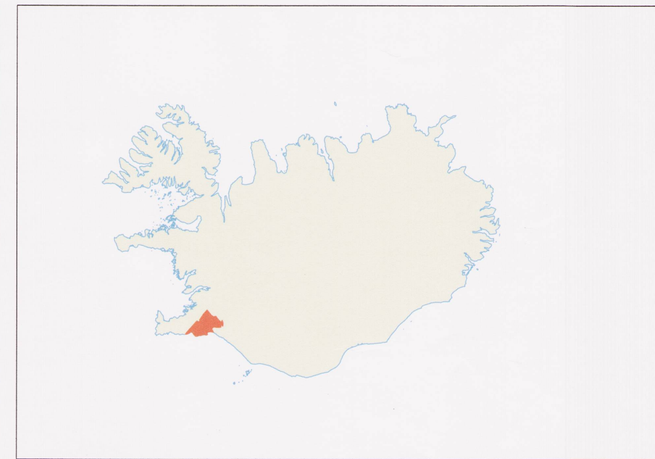
Yfirlitsmynd Mkv. 1:500.000.