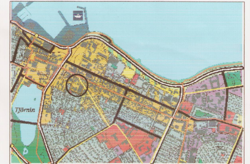
Hluti Aðalskipulags Reykjavíkur 1996-2016 Mkv. 1:20 000

Nýtingarhlutfall, fyrir breytingu 0,99 Nýtingarhlutfall, eftir breytingu 1,03 Breyting + 3,8 %