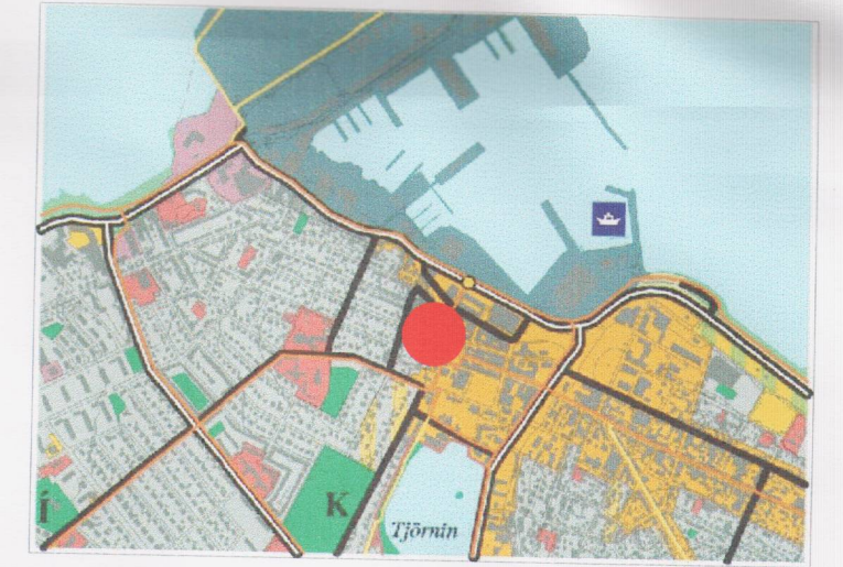
HLUTI ADALSKIPULAGS REYKJAVÍKUR 2001-2024

Deiliskipulagsbreyting þessi var í kynningu frá 2. marz 2004 til 30. marz 2004