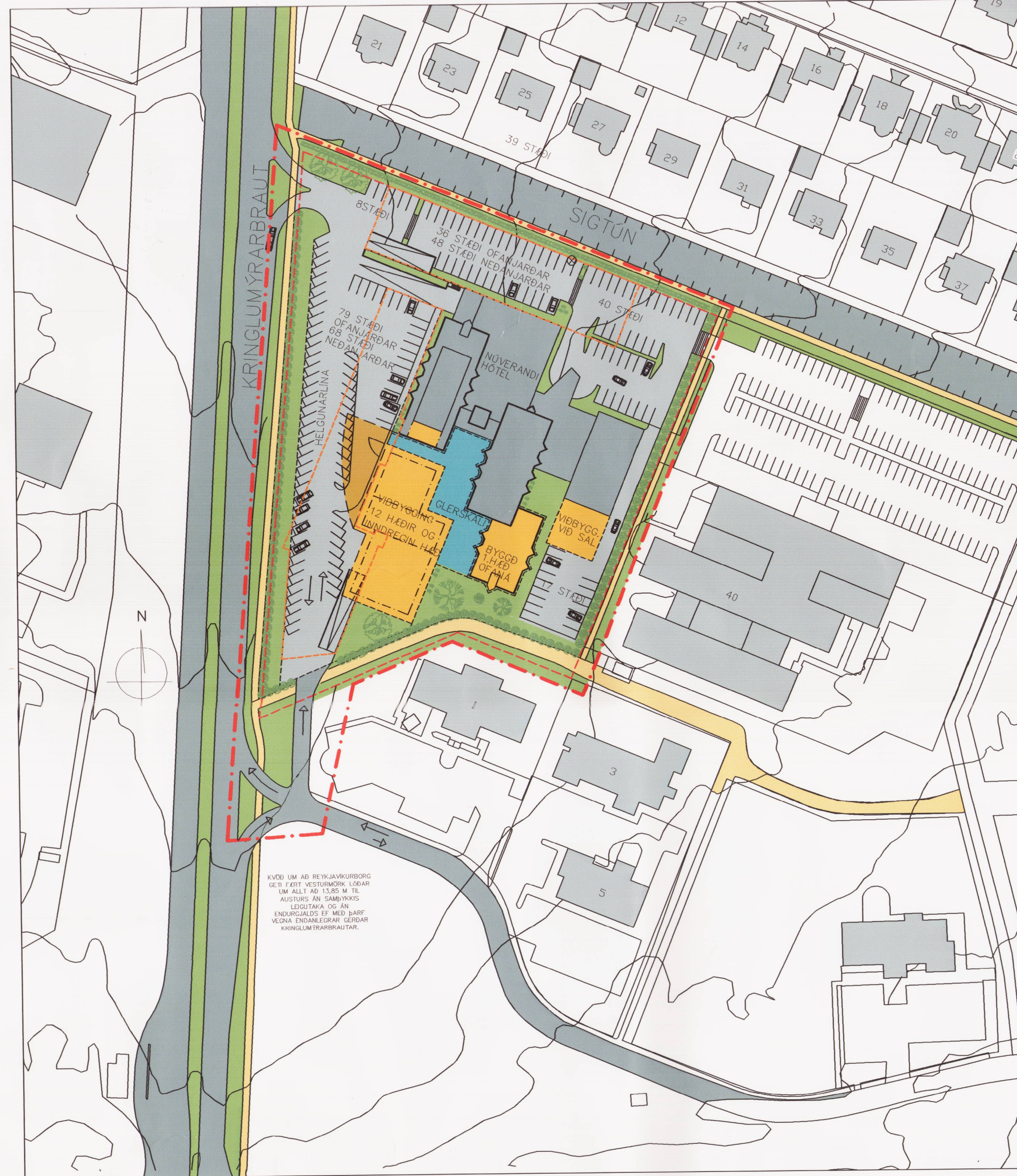
EFTIR BREYTINGU MKV. 1:1000