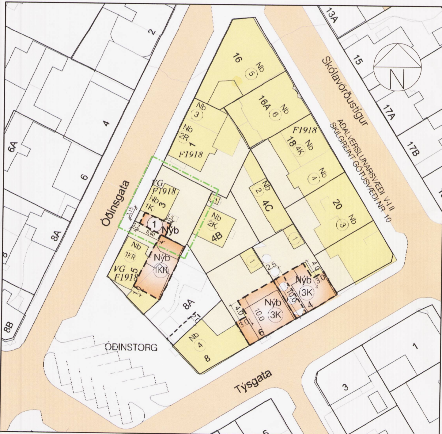
BREYTT DEILISKIPULAG FYRIR ÖÐINGSGÖTU 3, mkv. 1:500

FORSENDUR: ÞAR SEM SUD-AUSTURHORN LÓÐARINNAR ER BEST NÝTILEGI HLUTI LÓÐARINNAR TIL ÚTIVISTAR, ER EKKI FÝSILEGT AD FÓRNA HONUM UNDIR BÍLGEYMSLU.