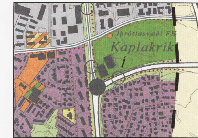
ADALSKIPULAG HAFNARFJARÐAR 2005-2025

Hámarksbyggingarmagn á lóð án bilastæðahúss er 43.500m 2 og hámarksnýtingarhlutfall 0,43 Hámarksbyggingarmagn á lóð með bilastæðahúsi er 48.125m 2 og hámarksnýtingarhlutfall 0,49.