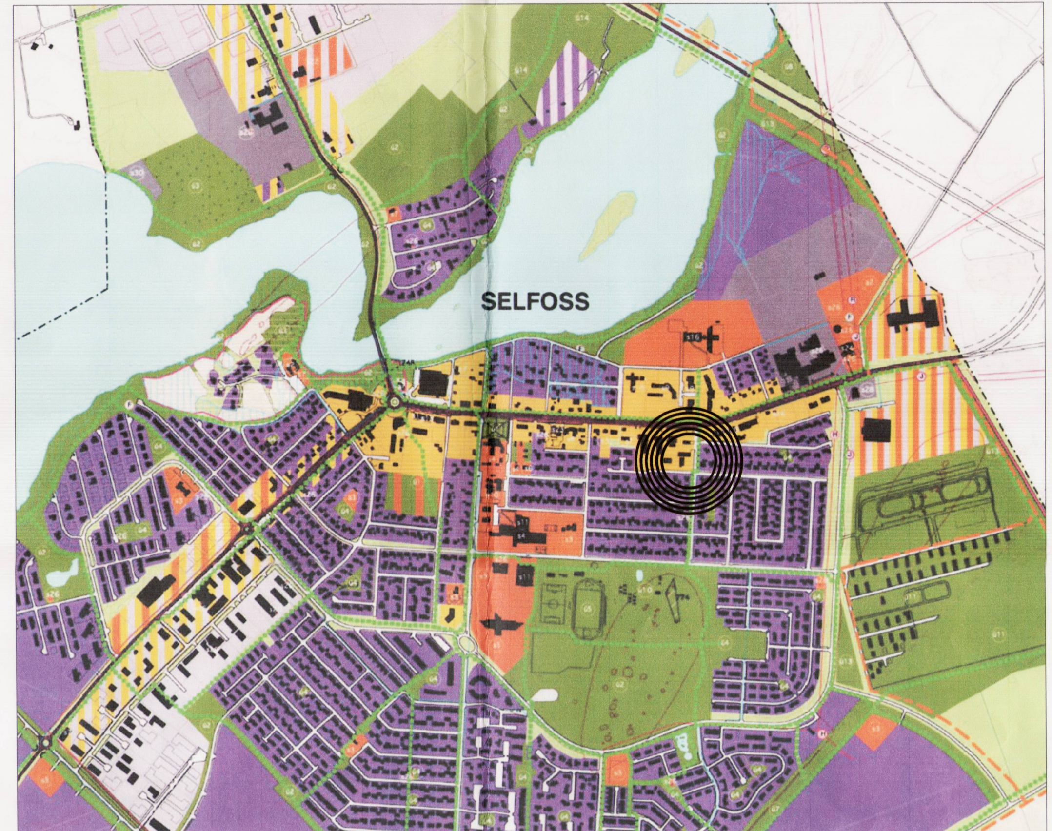
Hluti af samþykktu aðalskipulagi fyrir Árborg, þéttbýli