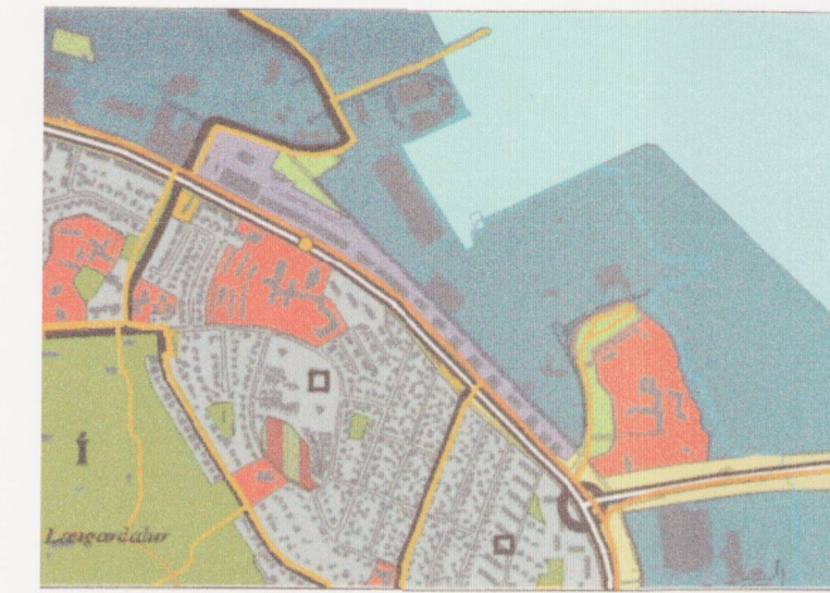
GILDANDI AÐALSKIPULAG MKV. 1:15.000

Sýnd bifstæði á uppdrætti eru til viðmiðunar og er heimilt að breyta þeim ef það leiðir til betra fyrirkomulags á lóðinni.