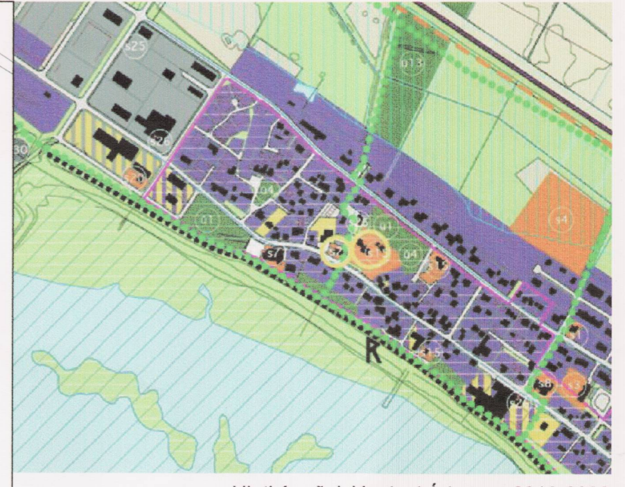
Hluti úr aðalskipulagi Árborgar 2010-2030