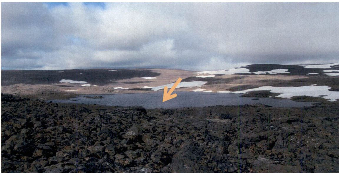
Mynd 8-1 Landslag á Hófsárveitusvæði og fyrirhugað stíflustæði við útrennsli Grímsvatns niður í Hófsárdal (ljósa örin).

Samkvæmt lögum um náttúruvernd (61. gr.) skal stuðla að vernd jarðfræðilegrar fjölbreytni landsins með því m.a. að vernda vatnsfarvegi, fossa og stöðuvötn svo sem kostur er. Í lögunum segir að stöðuvötn og tjarnir stærri en 1000 m 2 að flatarmáli njóti sérstakrar verndar í samræmi við markmið laganna um að viðhalda sérstakri vernd tiltekinna vistkerfa og jarðminja. Vötnin fjögur sem verða fyrir áhrifum af framkvæmdinni eru öll stærri en 1000 m 2 og njóta því verndar samkvæmt lögunum. Framkvæmdin hefur ekki áhrif á önnur vötn sem teljast óröskuð. Vatnið rennur að mestu leyti til sjávar eftir náttúrulegum farvegum sem þegar hefur verið raskað í fyrri framkvæmdum virkjunarinnar eða eftir rennisskurðum og vatnspípum.