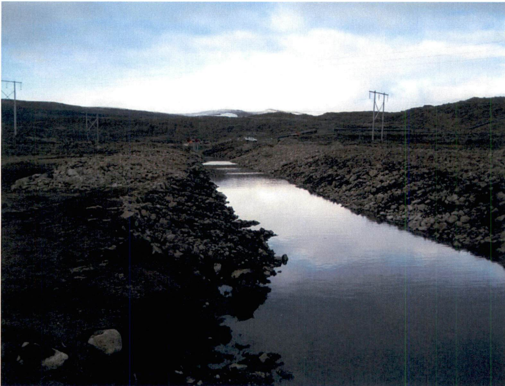
Mynd 8-4 Dæmi um veituskurð við Prestagilsvatn á brúninni ofan við Borgarfjörð. Fyrirhugaðir skurðir verða að jafnaði dýpri og með brattari hliðum í klöpp.