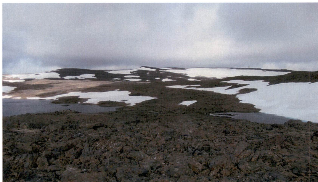
Mynd 8-3 Grímsvatn er til vinstri og vatn í 632 m hæð er í kvosinni á bakvið hæðina fyrir miðri mynd. Fjallið Sjónfríð ber við himinn. Fyrirhugaður veituskurður mun liggja í gegnum hæðina og tengja saman vötnin.