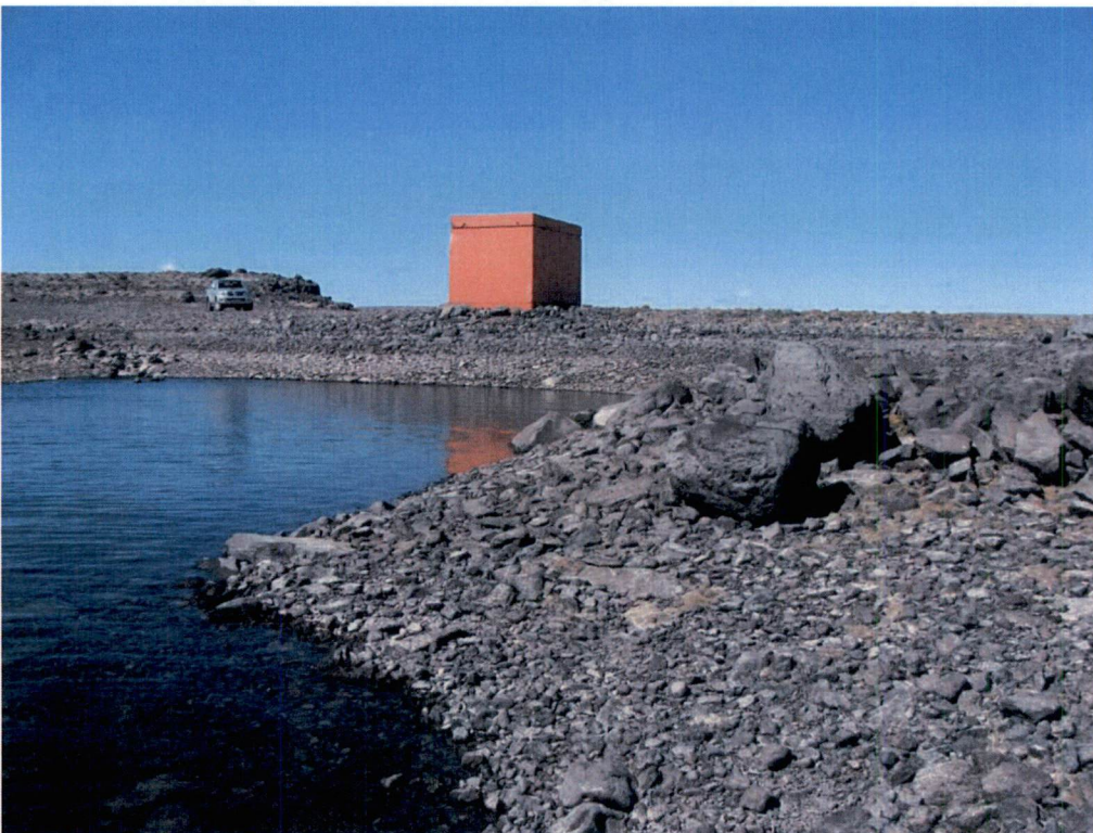
Mynd 8-5 Tangavatsnstífla. Fyrirhuguð stífla norðaustan við vatn í 626 m hæð verður svipuð ásýndar en hærri og lengri.