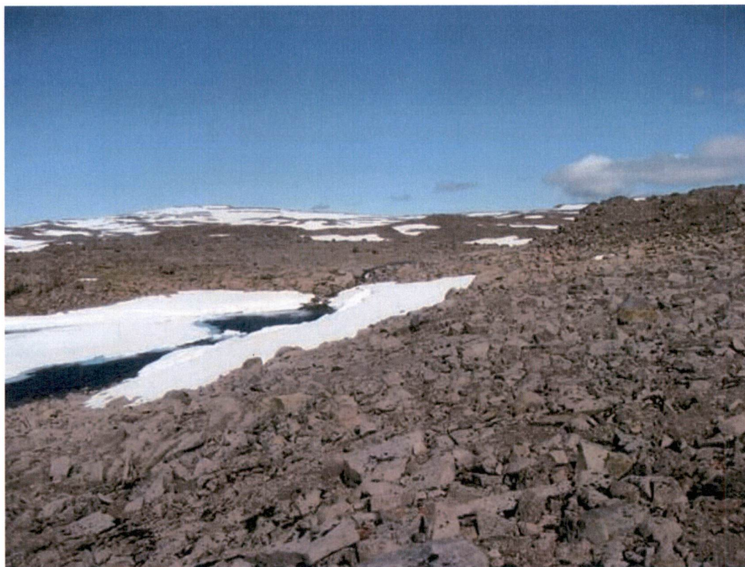
Mynd 8-2 Afrennsli úr Kattarvatni. Veituskurður mun beina þessu vatni í Tangavatn.