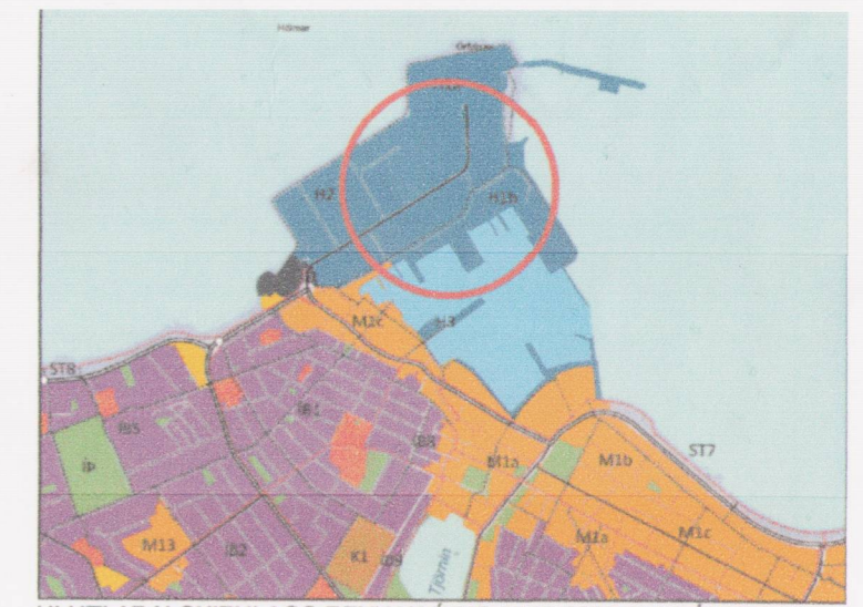
HLUTI ADALSKIPULAGS REYKJAVÍKUR 2010-2030 (EKKI Í KVARÐA)