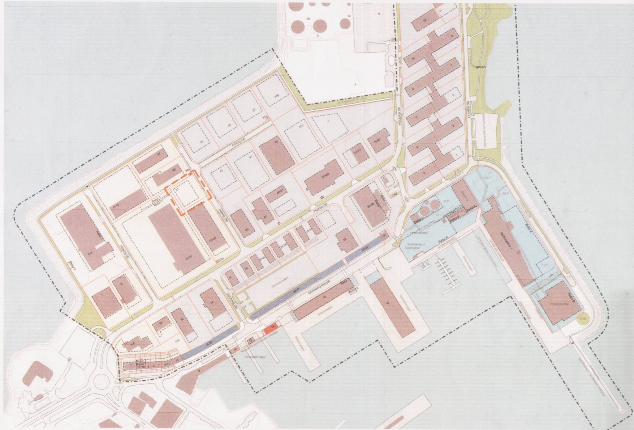
GILDANDI DEILISKIPULAG SAMÞYKKT Í BORGARSTJÓRN 3. NÓV. 2015, MEÐ BREYTINGU SAMÞYKKTRI Í UMHVERFIS- OG SKIPULAGSRÁÐI 4. MAÍ 2016 M.1:2000