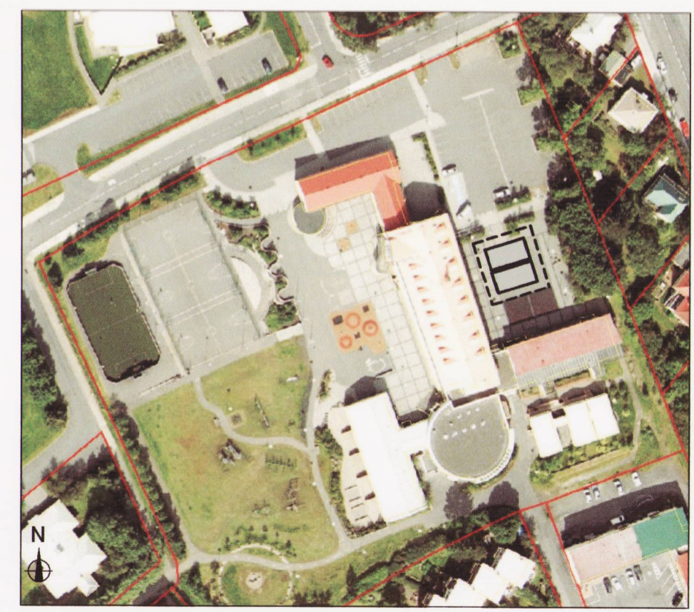
Skýringarmynd - loftmynd

Byggingarmagn færanlegra kennslustofa á reit á norðausturhluta lóðar. um 170 m2 Byggingarmagn færanlegra kennslustofa á reit á suðausturhluta lóðar. um 260 m2