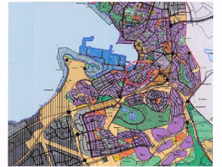
Hluti gjaldandi aðalskipulags Hafnarfjarðar 2013 - 2025 Deiliskipulagssvæði merkt inn með hring.