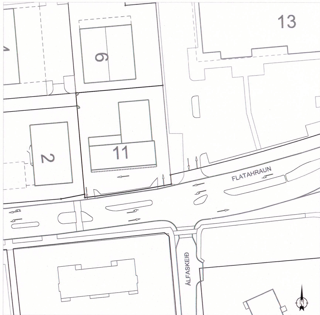
FYRIR BREYTINGU - Í GILDI FRÁ 25.02.2015, MKV: 1:1000