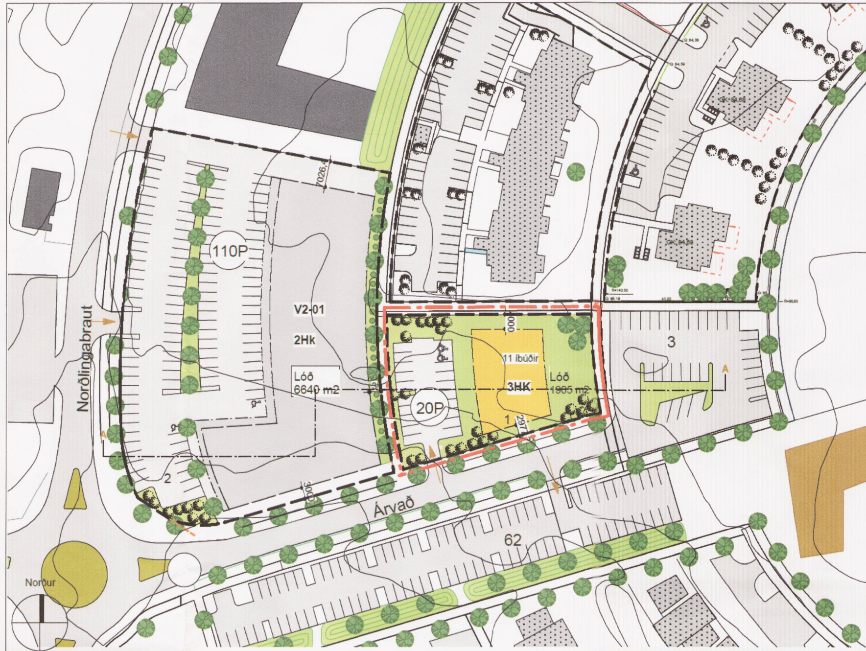
Tillaga að deiliskipulagi Mkv. 1:1000 í A2

Skilmálar Hér á eftir fara breyttir almennir skilmálar og sérskilmálar fyrir lóðina Árvað 1. Að öðru leyti gilda almennir skilmálar fyrir svæðið samþykkt í borgarráði 6. janúar 2004. Að öðru leyti gilda eldri skilmálar.