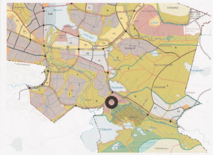
Staðsetning reits skv. aðalskipulagi Reykjavíkur 2001-2024