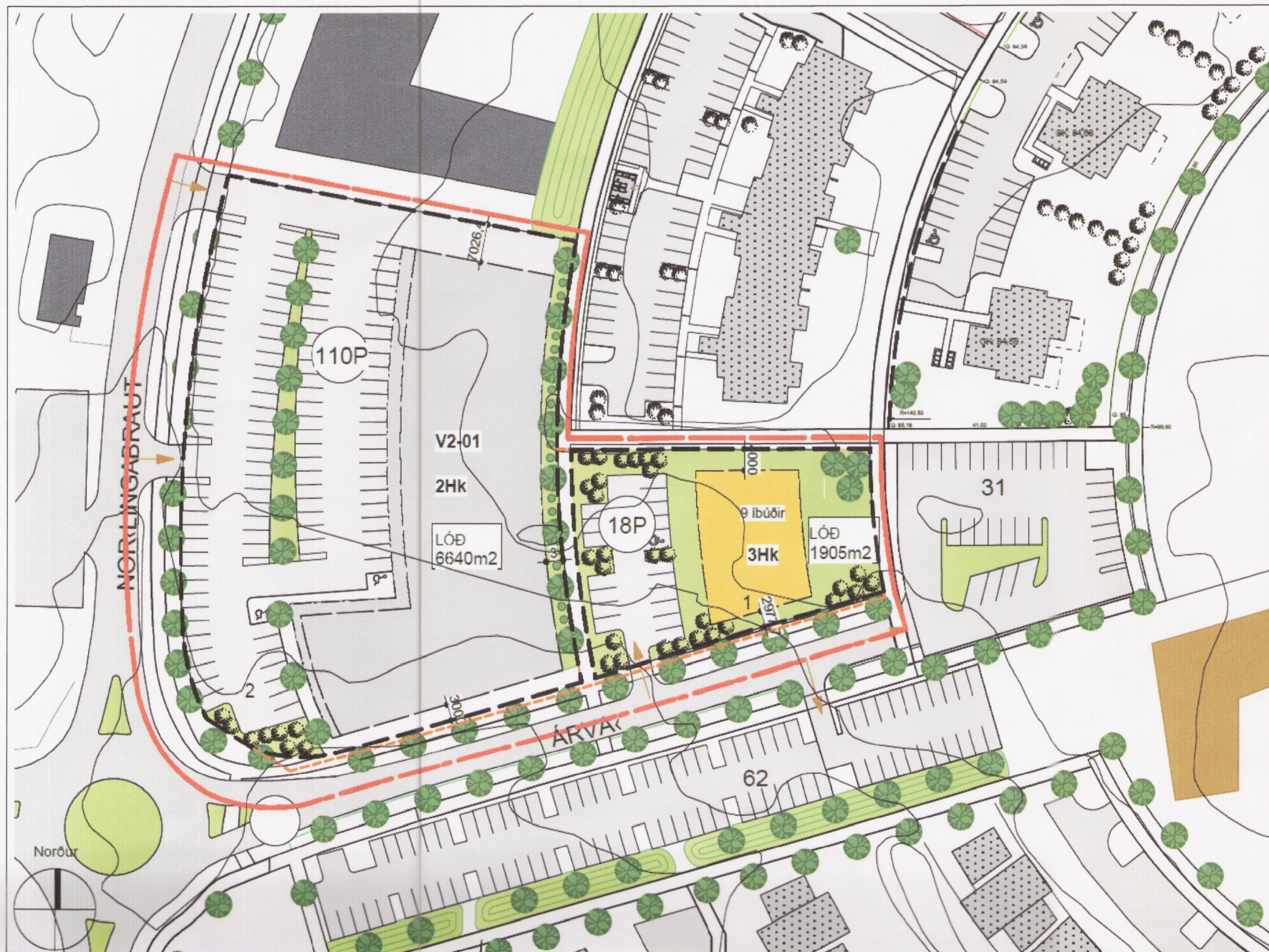
Gildandi deiliskipulag "Norðlingaholts vegna Árvaðs 1" samþ. í borgarráði 30.10.2008 Mkv. 1:1000 í A2