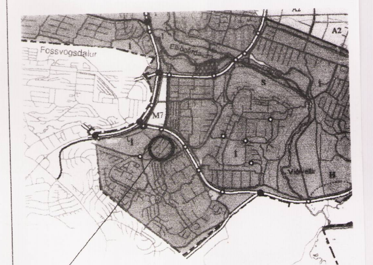
Hluti aðalskipulags Reykjavíkur 2001-20024

Handwritten signatures and names: Fjóðaþingur Bláskógum 12 Bláskógum 11 Bláskógum 9 Bláskógum 9 Bláskógum 9 Bláskógum 9