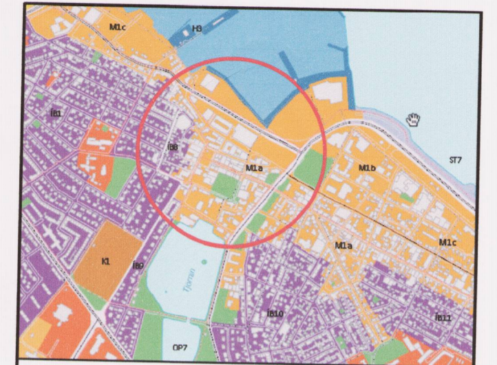
AÐALSKIPULAG REYKJAVÍKUR 2010-2030 YFIRLITSMYND