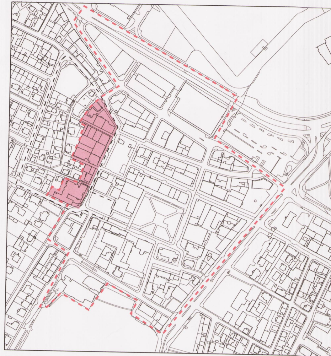
Skýringarmynd: Afmörkun svæðis með takmörkun á landnotkun. Mkv. 1:4000