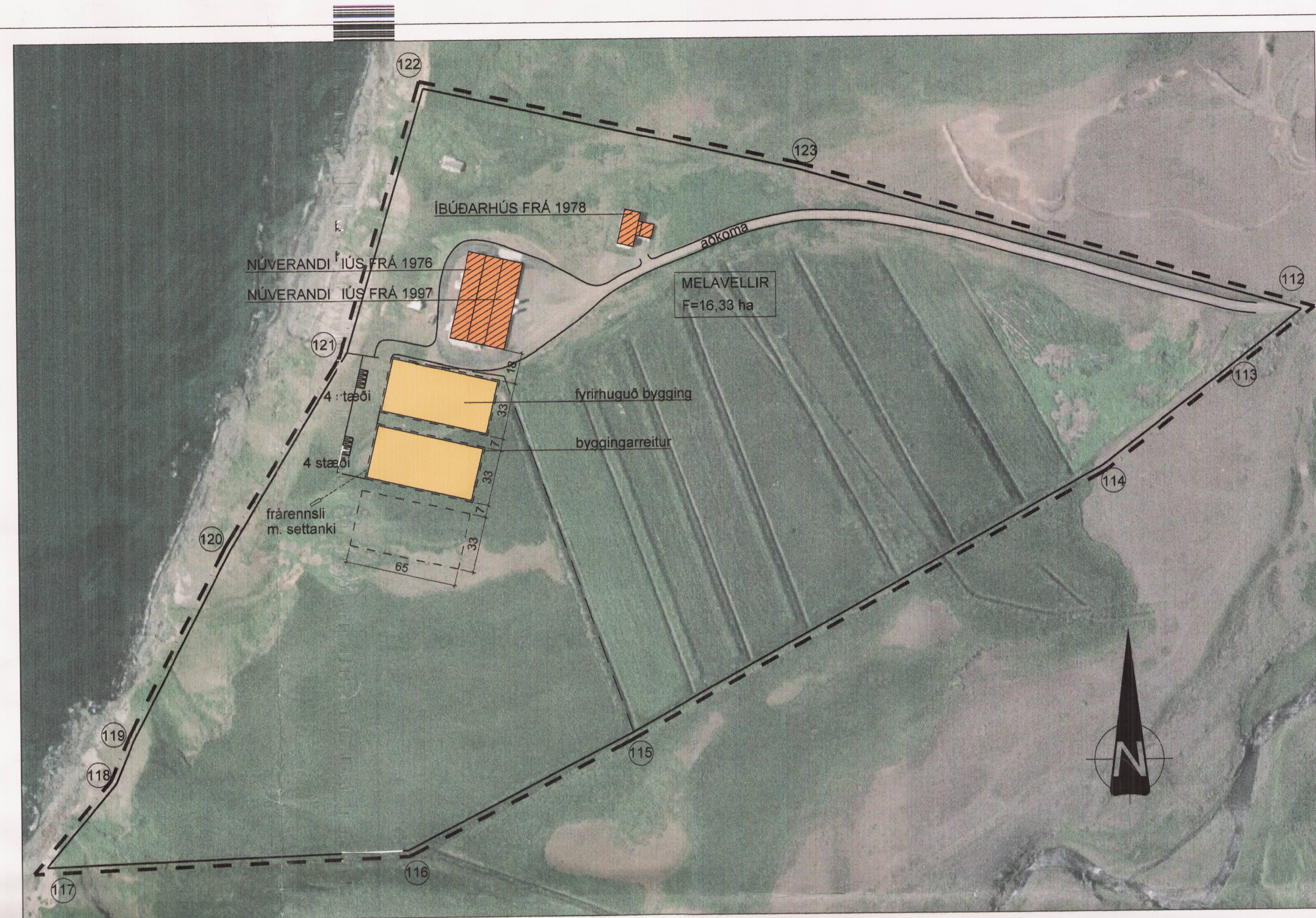
GILDANDI DEILISKIPULAG M 1 : 2000