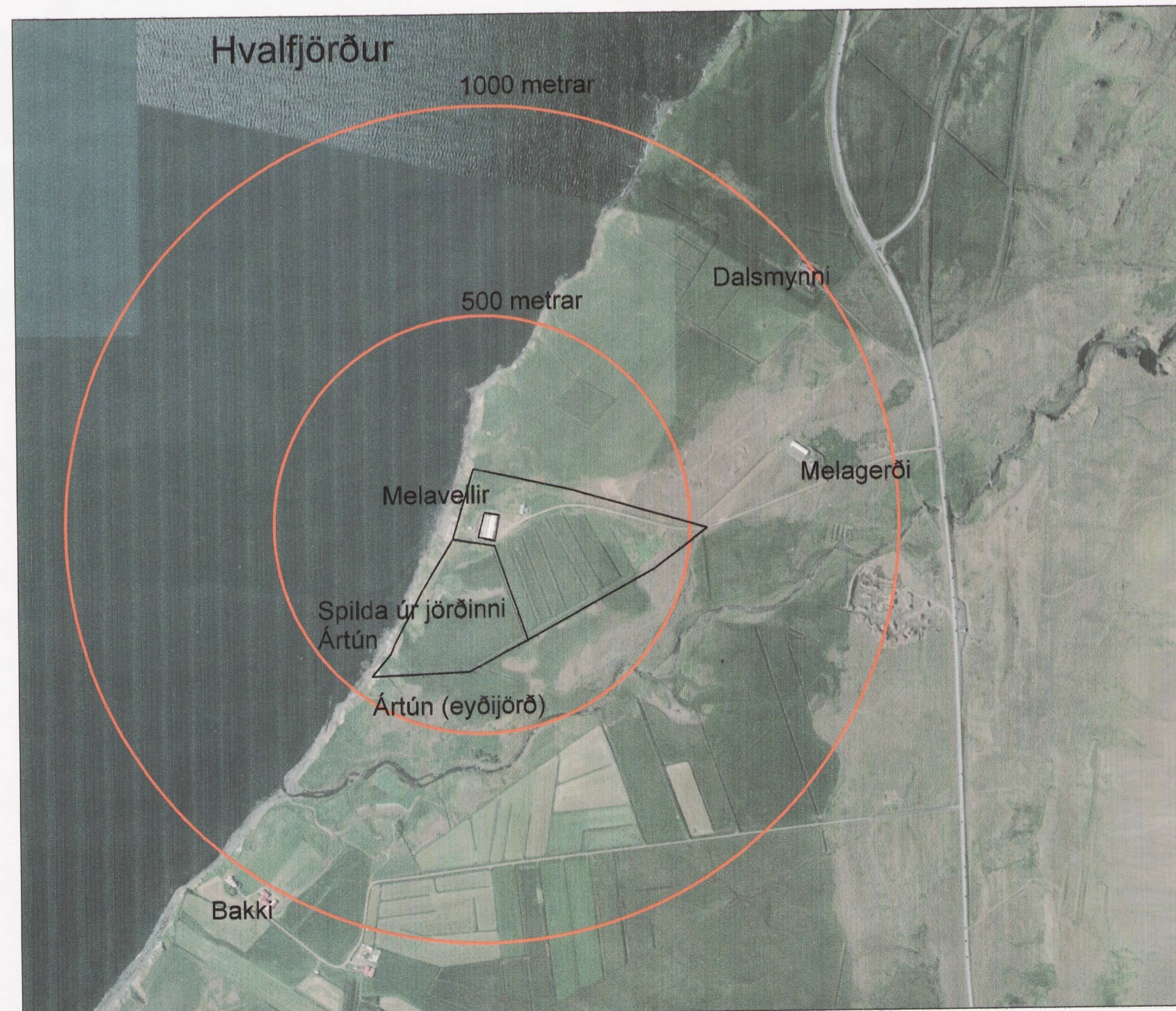
FJARLÆGÐIR Á MILLI BYGGINGA M 1 : 500

Breyting á deiliskipulagi Melavalla fellur undir lög um umhverfismat áætlana nr. 105/2006. Gerð er grein fyrir umhverfisáhrifum tillögunnar í meðfylgjandi umhverfisskýrslu. Umhverfisskýrsla - fylgiskjal með tillögu að breytingu á deiliskipulagi, dagsett 15. apríl 2015.