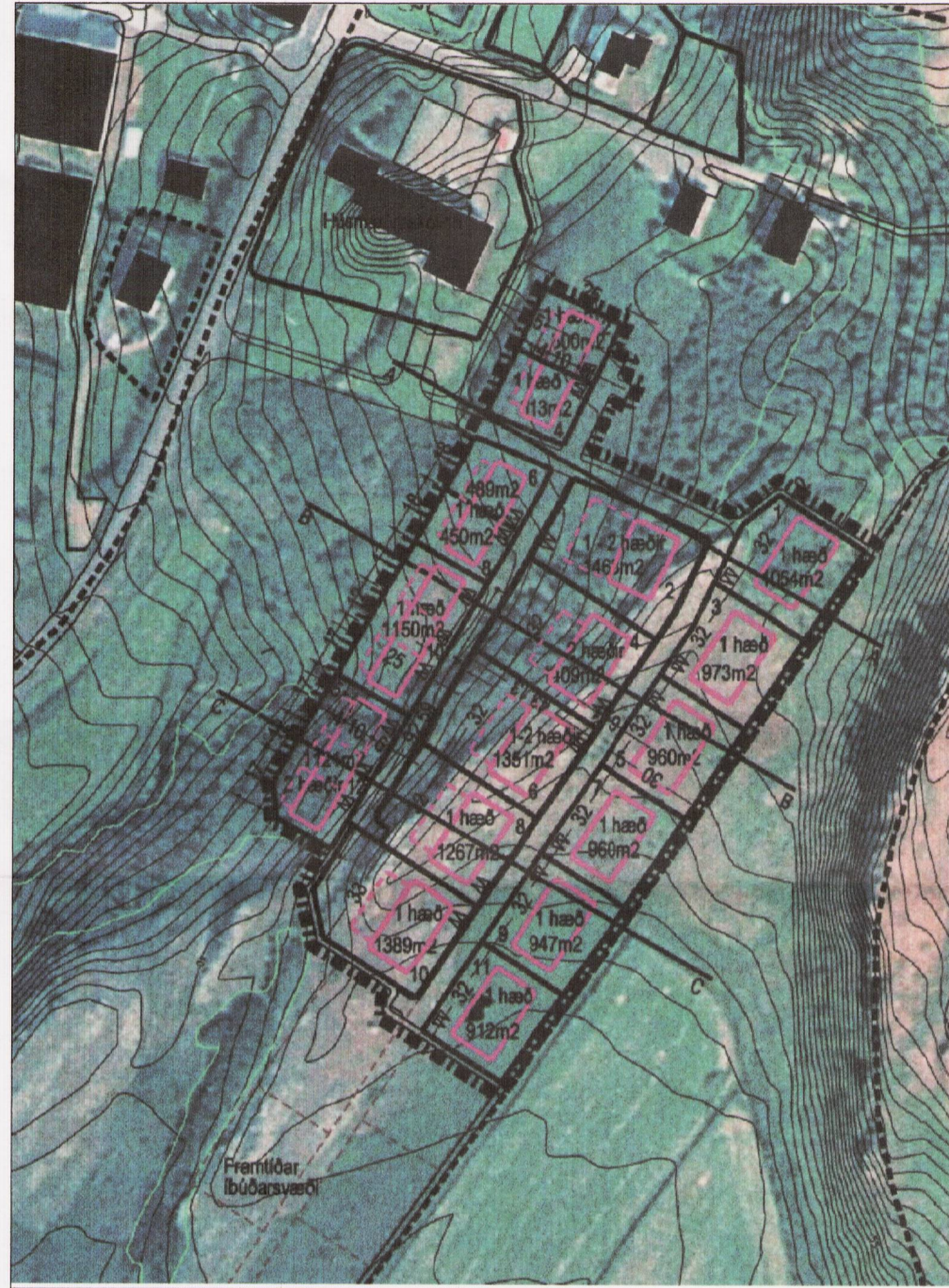
Deiliskipulag íbúðabyggðar að Varmalandi, fyrir breytingar 1:2000 Deiliskipulag samþykkt í bæjarstjórn Borgarbyggðar 17.11.2005 Auglýst í B-deild 9.mars 2006