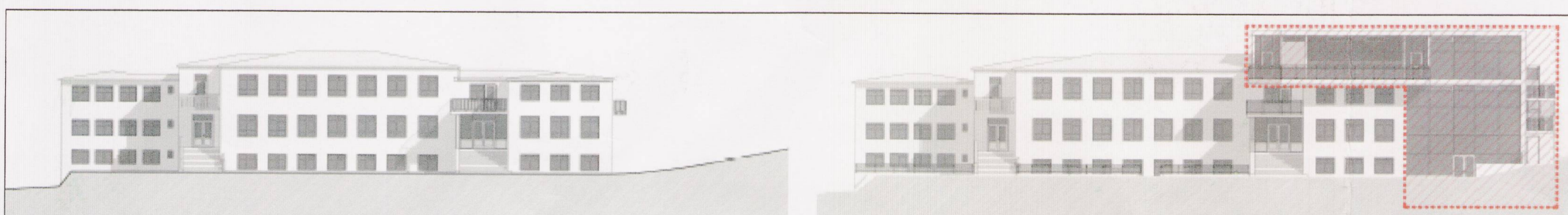
Skýringarmynd - núverandi útlit suður