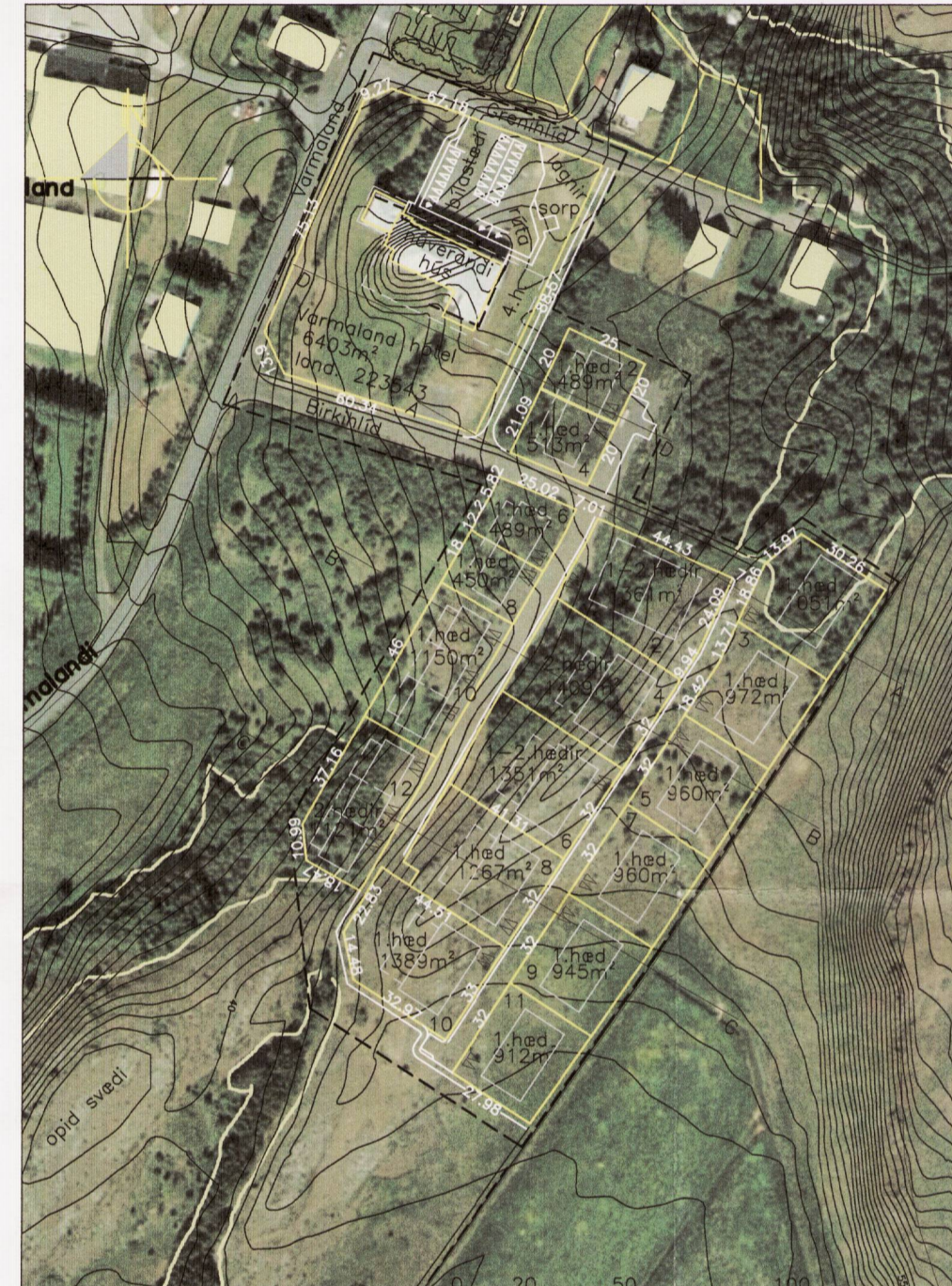
Deiliskipulags tillaga eftir breytingar 1:2000 Unnið eftir loftmynd og skipulagsgrunn frá Borgarbyggð