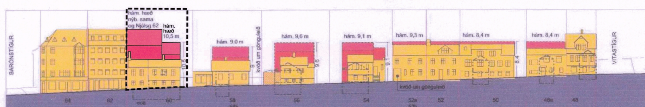
Deiliskipulagstillaga - Götumynd/ásýnd að Njálsgötu