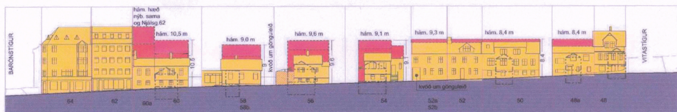
Gildandi - Götumynd/ásýnd að Njálsgötu