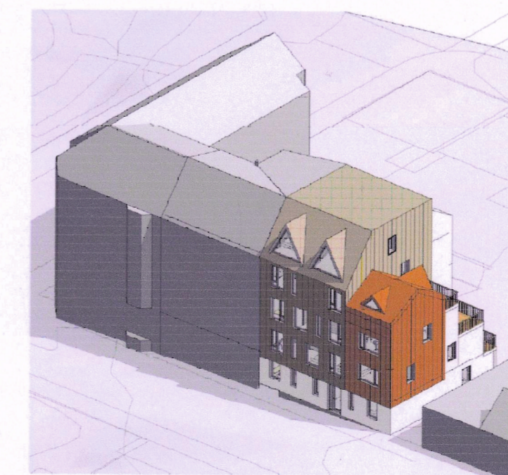
Skýringarmynd til suðurs

Deiliskipulagsuppráttur (90)1.01 Deiliskipulag Njálsgöturéits 3