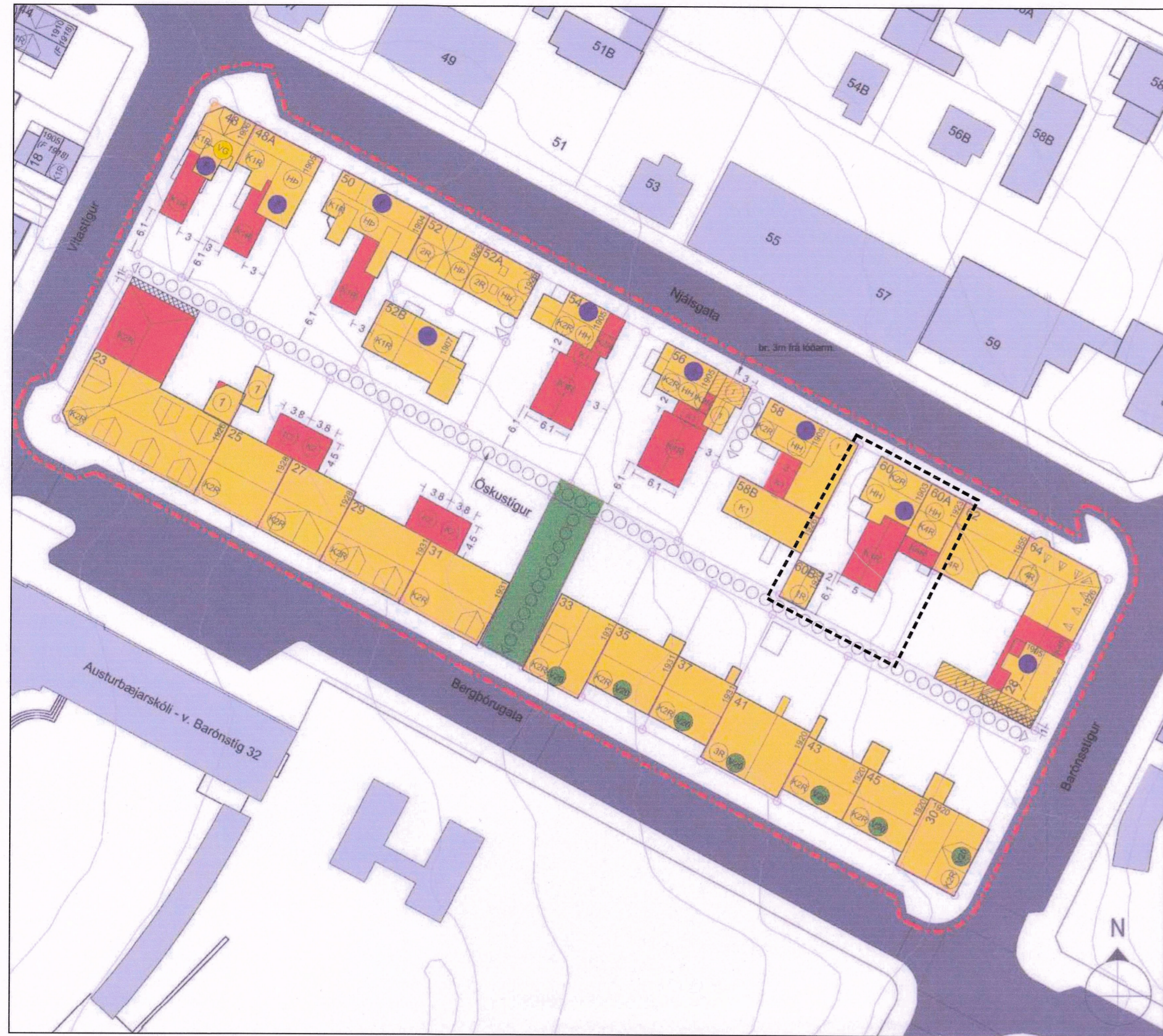
Gildandi deiliskipulag, samþykkt í borgarráði 26.sept. 2013 auglýst í b-deild Stjórnatíðinda 7.nóv 2013. Mkv. 1:500