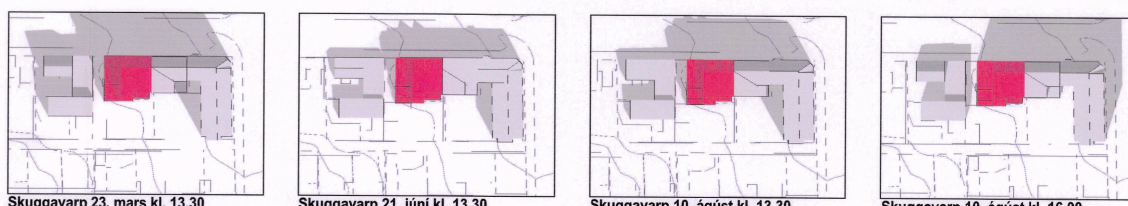
Skuggavarp 23. mars kl. 13.30