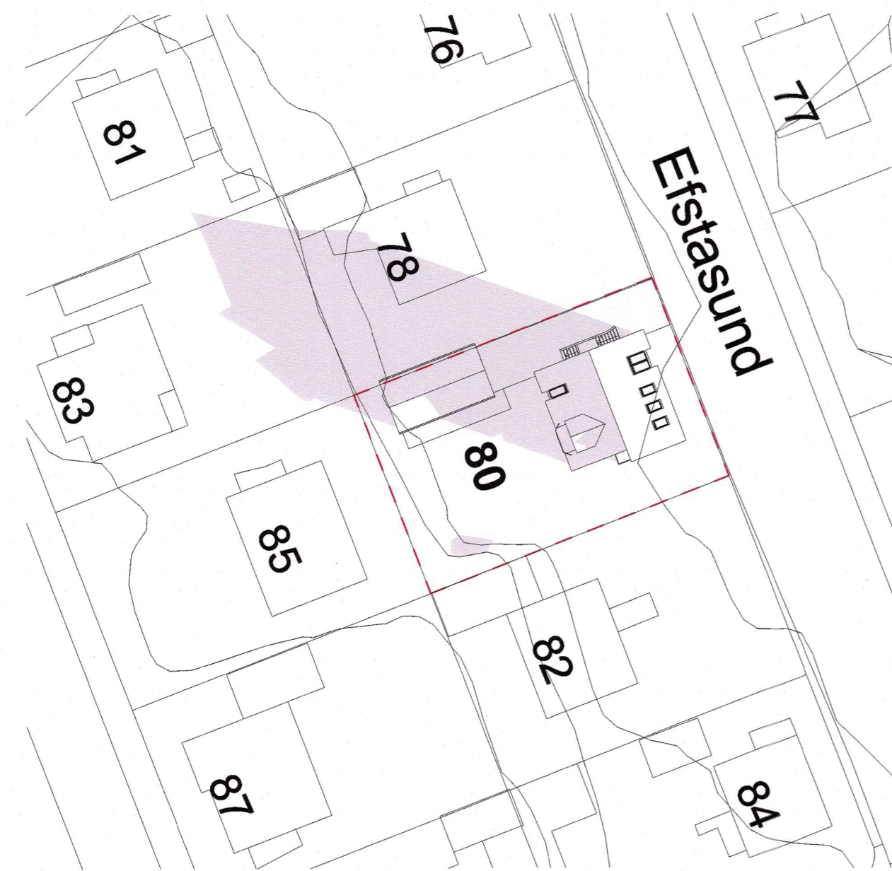
4 Skuggavarp eftir breytingu að jafndægri kl. 09_00 1: 500