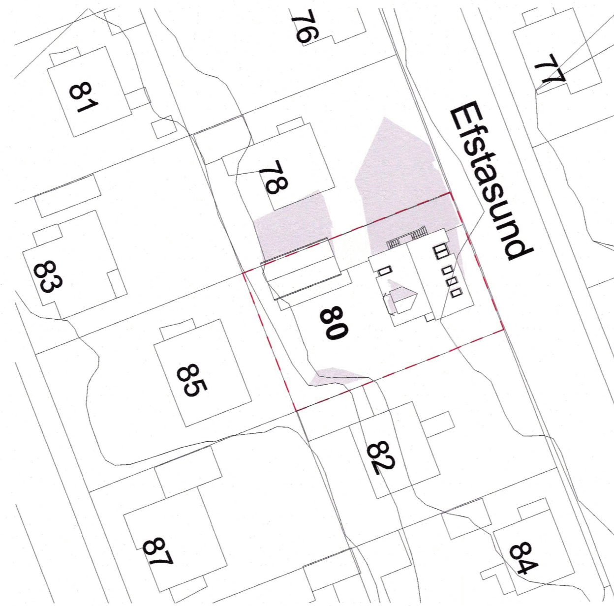
5 Skuggavarp eftir breytingu að jafndægri kl. 13_00 1: 500