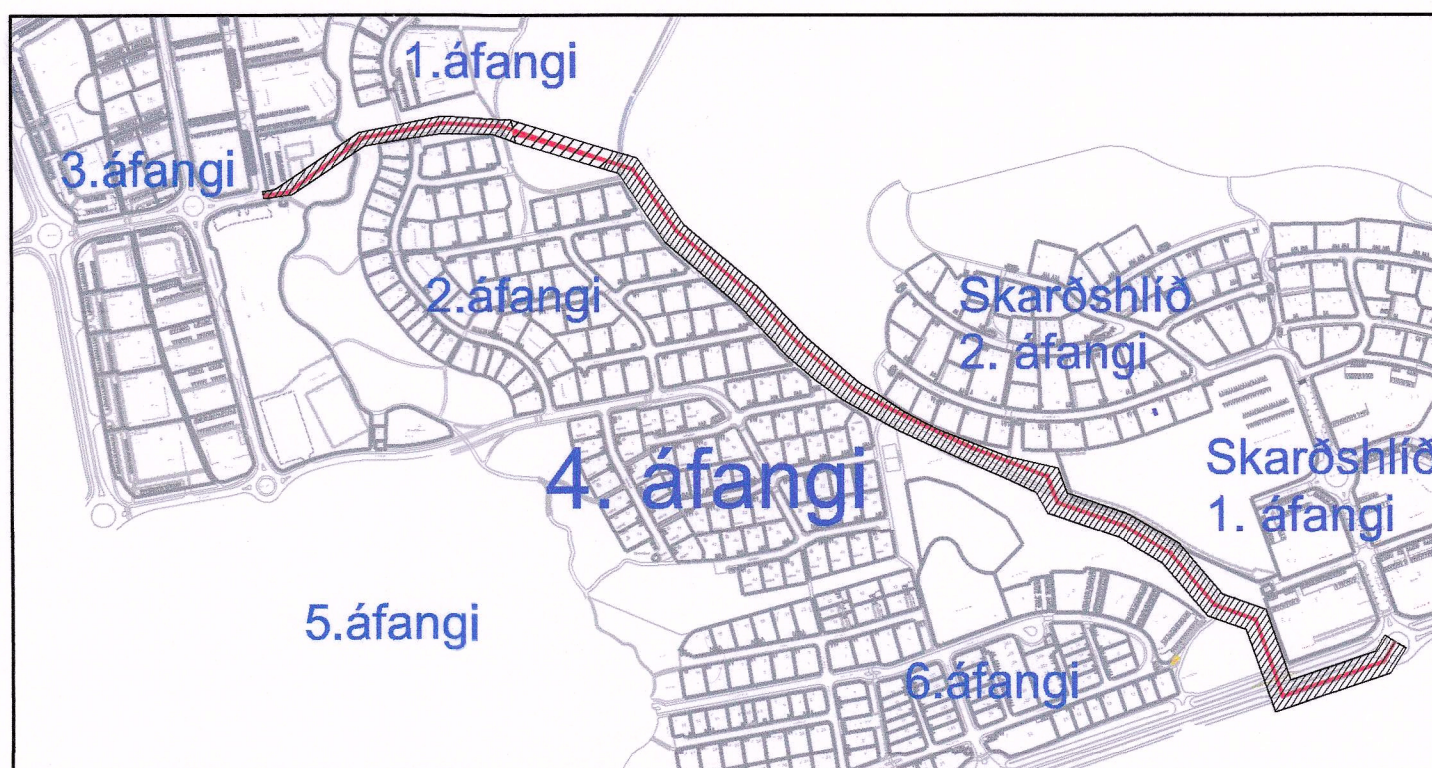
Yfirlitsmynd af Völlum. Ræsi liggur meðfram 4. áfangi. Mkv. 1:7500