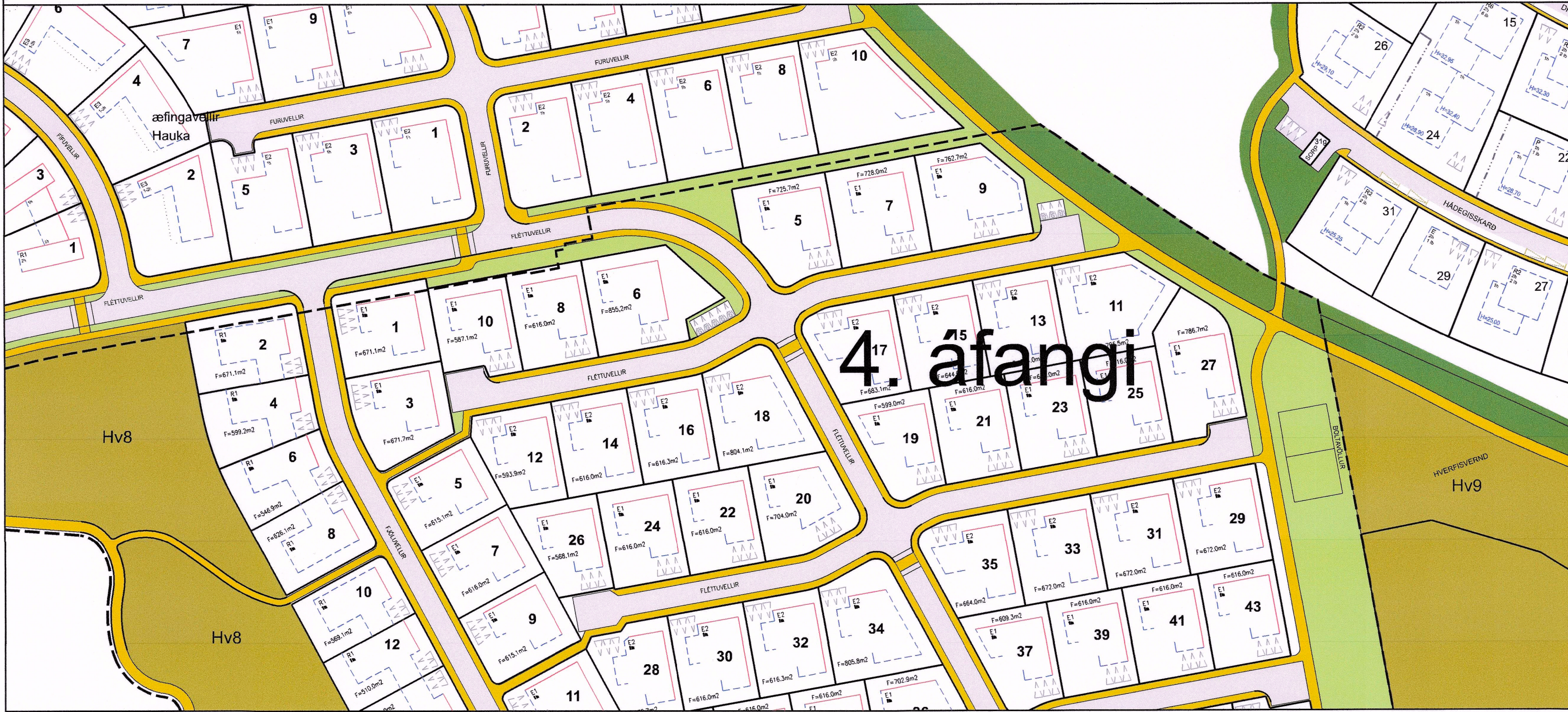
Gildandi deiliskipulag Vellir 2. áfangi. Samþykkt 19.09.2004 m. s. br. Mkv. 1:1000