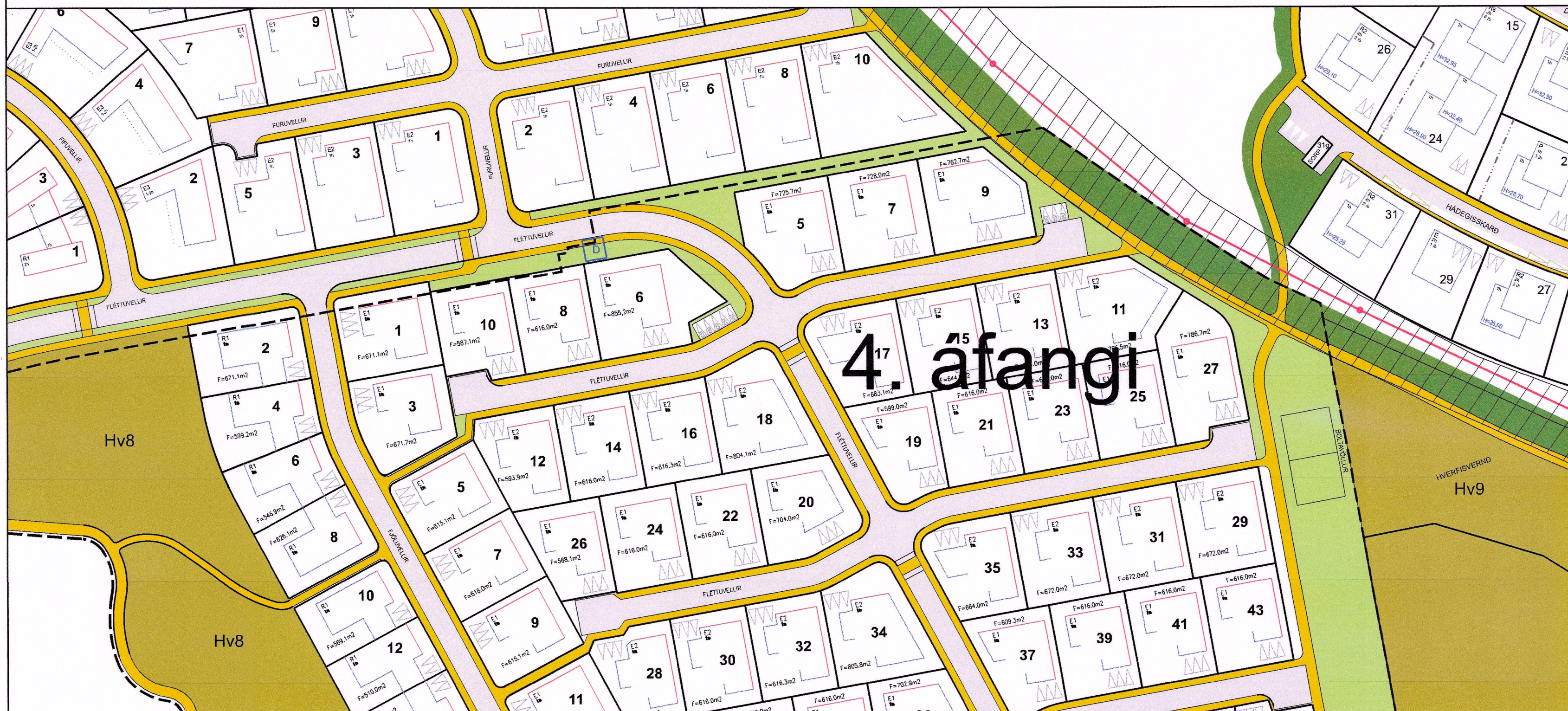
Breyting á deiliskipulagi Vellir 2. áfangi, febrúar 2020. Mkv. 1:1000

Greinargerð Með deiliskipulagsbreytingu þessari er ætlað að koma fyrir stofnræsi frá Nöntorgi að Hraunavallaskóla.