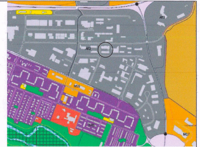
Hluti Aðalskipulags Reykjavíkur 2010-2030, staðsetning svæðisins.

Að öðru leiti gilda skilmálar gildandi deiliskipulags.